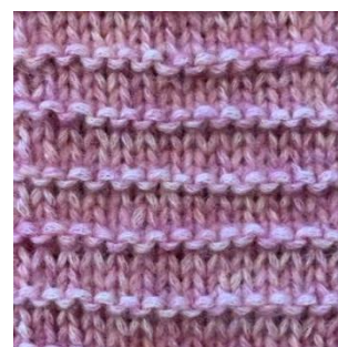
Kombination av räta och aviga maskor.