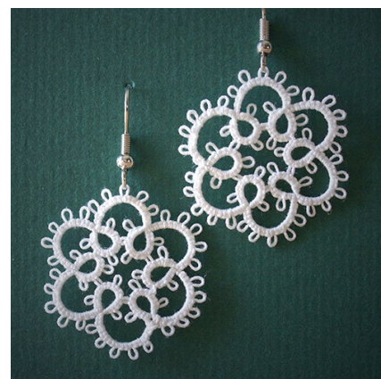
Det här mönstret kan bli ett par söta örhängen.

Förkortningar: 1 (siffra) = antal dubbelknutar - = picot + = sammanfoga