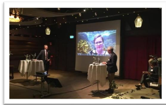
Sveriges och Finlands miljöministrar deltog i Östersjöseminariet den 18 november på Högloftet, Skansen. Per Bolund fanns på plats och Krista Mikkonen deltog via videolänk.