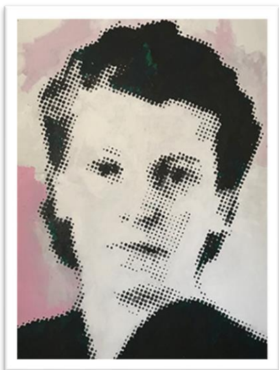
Konstverket "Mormor/Mummu".

samt individens ursprung och sätter mänskliga relationer i fokus.”