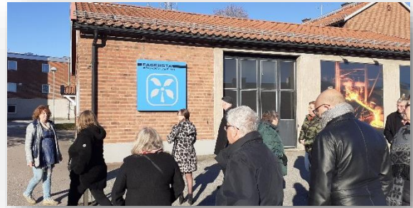
Rundvandringen under höstmötet stannade bland annat vid Fagersta Bruksmuseum.