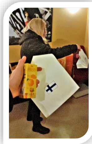
Vid entrén till salong 3 försågs biobesökarna med varsin finländsk snackpåse.

Söndagen den 5 december ordnade Föreningen Svenska Österbottningar i Stockholm en visning av "Maria's Paradise" på biograf Zita. 17 personer deltog i självständighetsfirandet för att se den verklighetsbaserade spelfilmen om finländska sekt- ledaren Maria Åkerbloms liv.