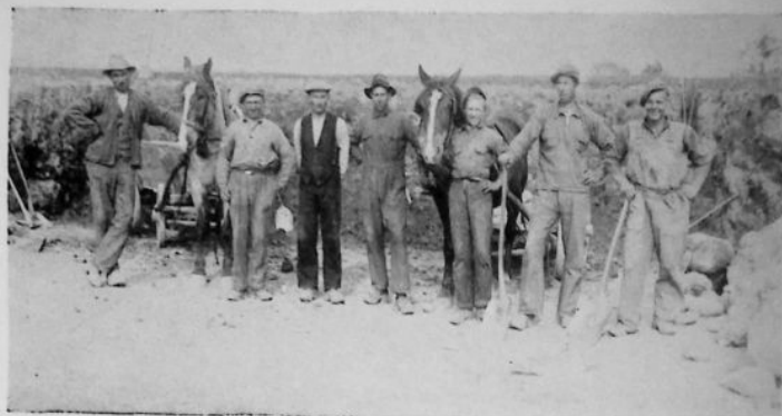
Arbetslag vid vägbygget Frenninge-Vallarum-Molleröd 1932—1935.