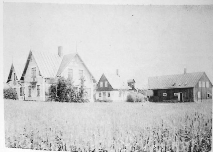
Syfabriken i Vallarum.

Industrialisering gjorde också intryck i Vallarum. I slutet av 1800-talet bedrevs privat mejeri i nuvarande smedjan No 7. Ett mindre färgeri in-