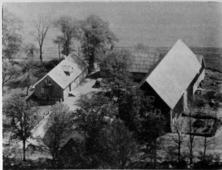
Skumpens gård. 1950-talets byggnadsstil.

År 1888 förvärvades nr 1 7 / 128 av Per Månsson och hustru Hanna, som