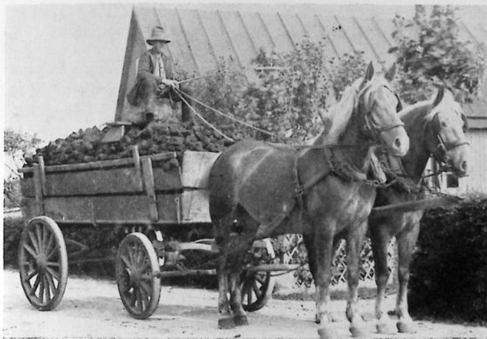
Torvkörning i Skumparp 1930.