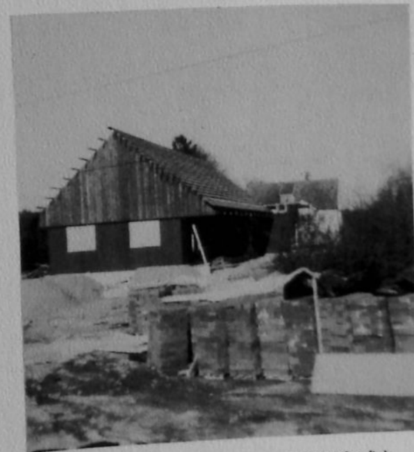
En ny villa byggs i Bjälkhult. Den första på många år i byn.