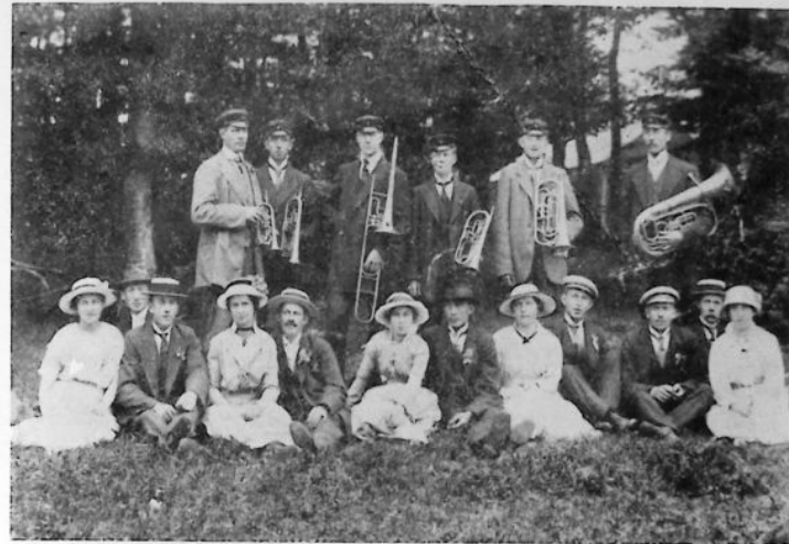
Hornmusikkåren "Lyran" vid gästspel i Bjälkhult omkring 1915.