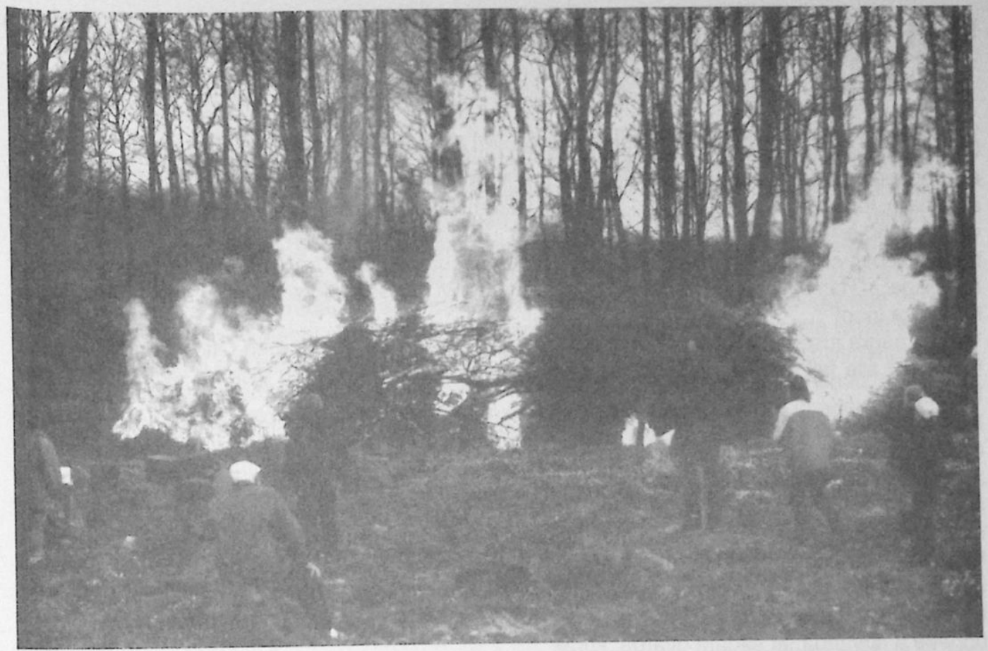
Tänk vad snällt, att bjuda alla som kommer på grillad korv och dricka.