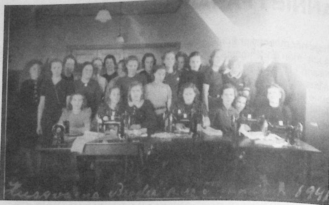
Sykurs i Frenninge skola 1941.