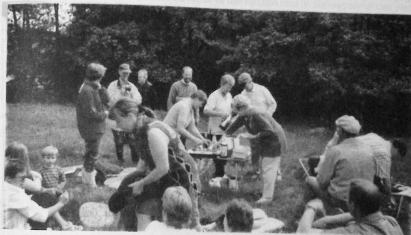
Kaffet avnjöts på Lejbacken i fäladen