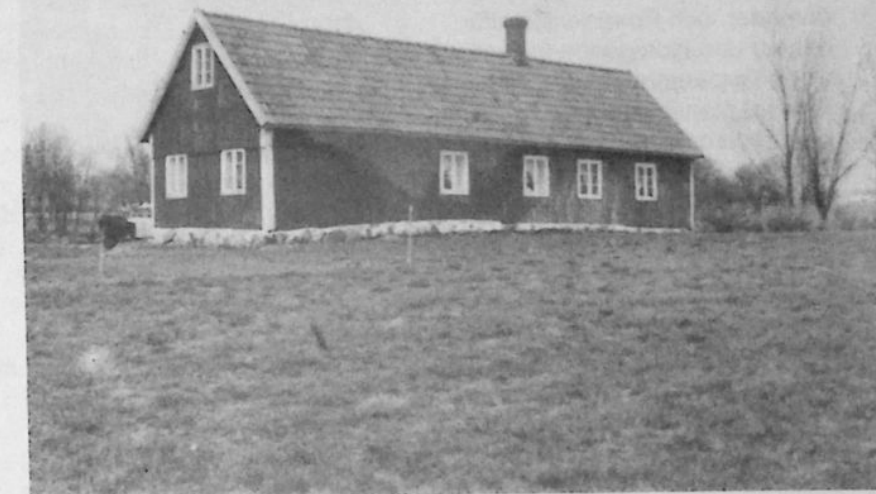
Så här såg det ut då 1970, Hused.