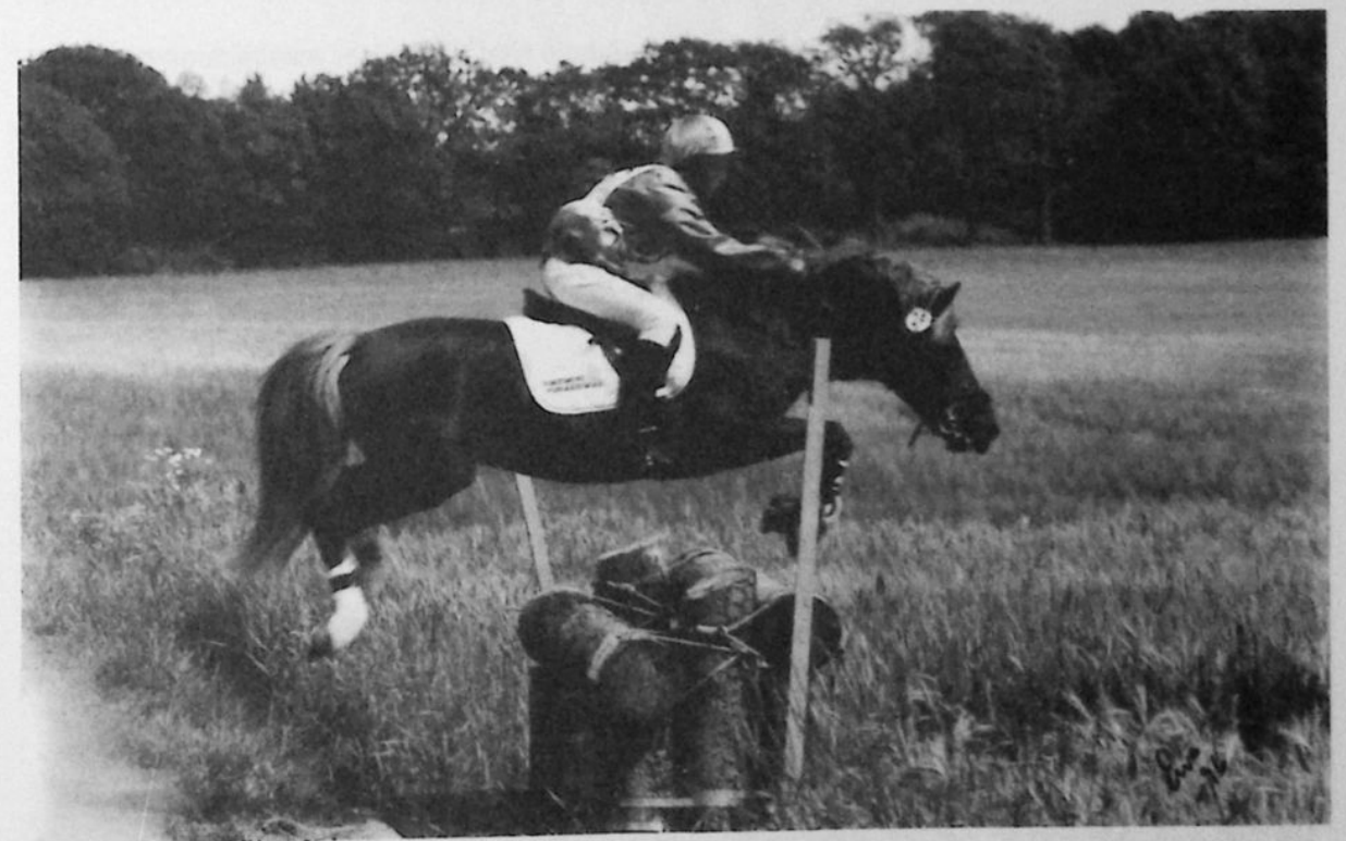
Detta är Fredriksbergs Esa och jag på SM i Tjolöholm.