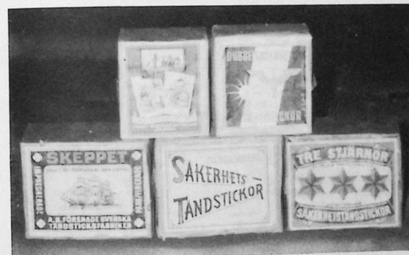
Ja, snart sagt allt från tändstickor till begravningskransar (t.h.) såldes i Starrarps affär.