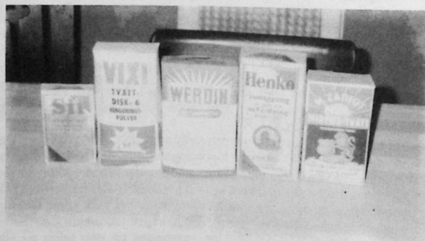
Gamla sorter tvätt- disk- och rengörings- medel. Den längst till vänster fanns redan före första världskriget.

Hennes upplevelse var nog så riktig. Väldigt lite hade förändrats fram till 1938. Men med Anton och Asta kom också moderniseringar. De spröjsade fönsterna i butiken byttes ut mot stora glas. Oljeeldning installerades, gammalt lager renades ut, mycket eldades upp och fler och nya varor kom i butiken, men det är en annan historia.