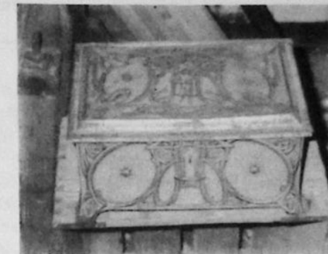
Karamellskrin från 1800-talet.