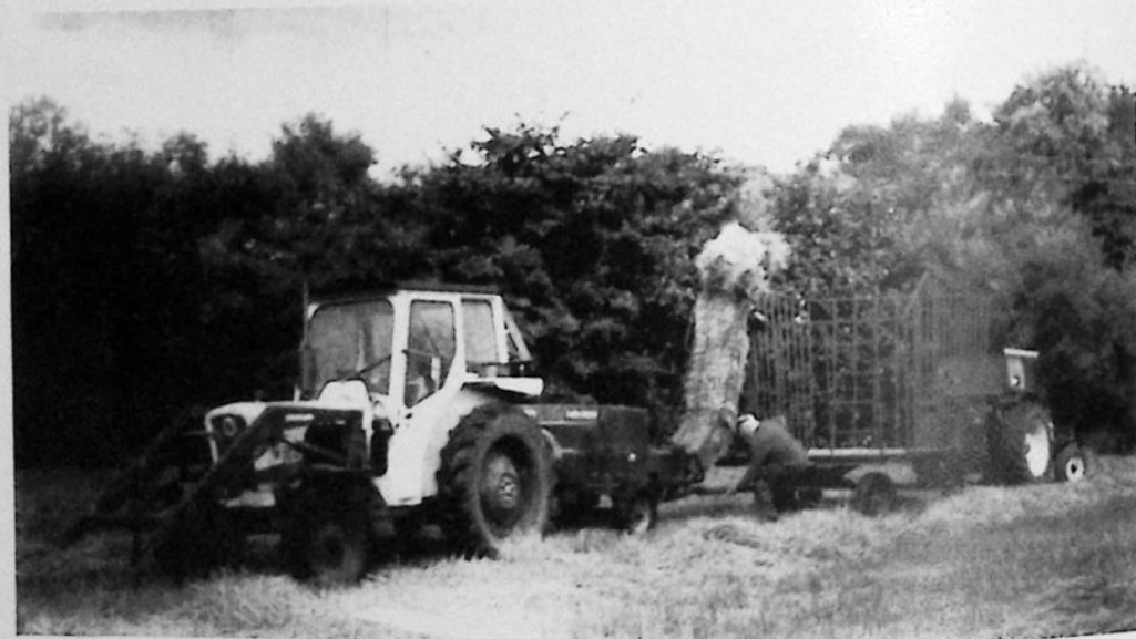
Här kopplas sista bälvagnen till pressen.