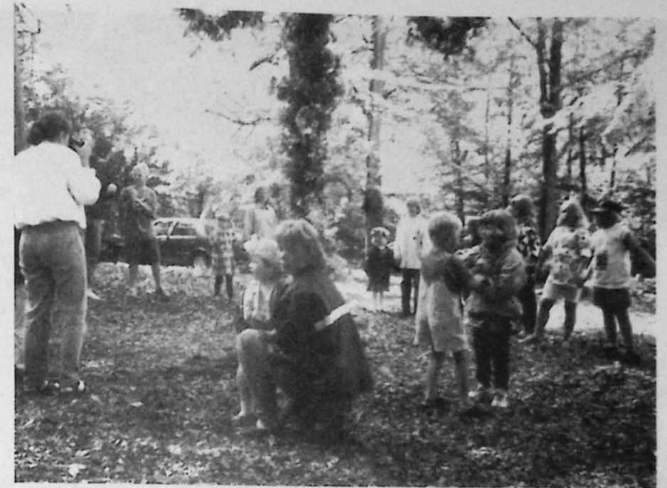
Här är två bilder från midsommardansen i Hårderupshult.