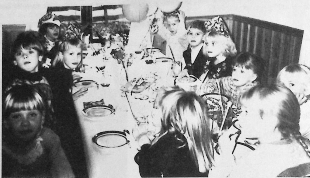
Barnkalas i Starrarp

Hårderupsposten har samlat samman ett stort antal bilder på barn i bygden och gjort ett urval som presenteras här. Alla barn är inte med men de flesta och bilderna är från de senaste c.a fem åren.