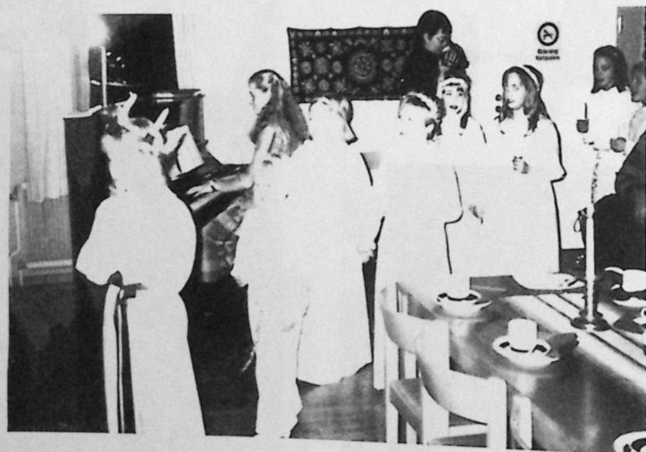
Starrarps eget luciatåg.