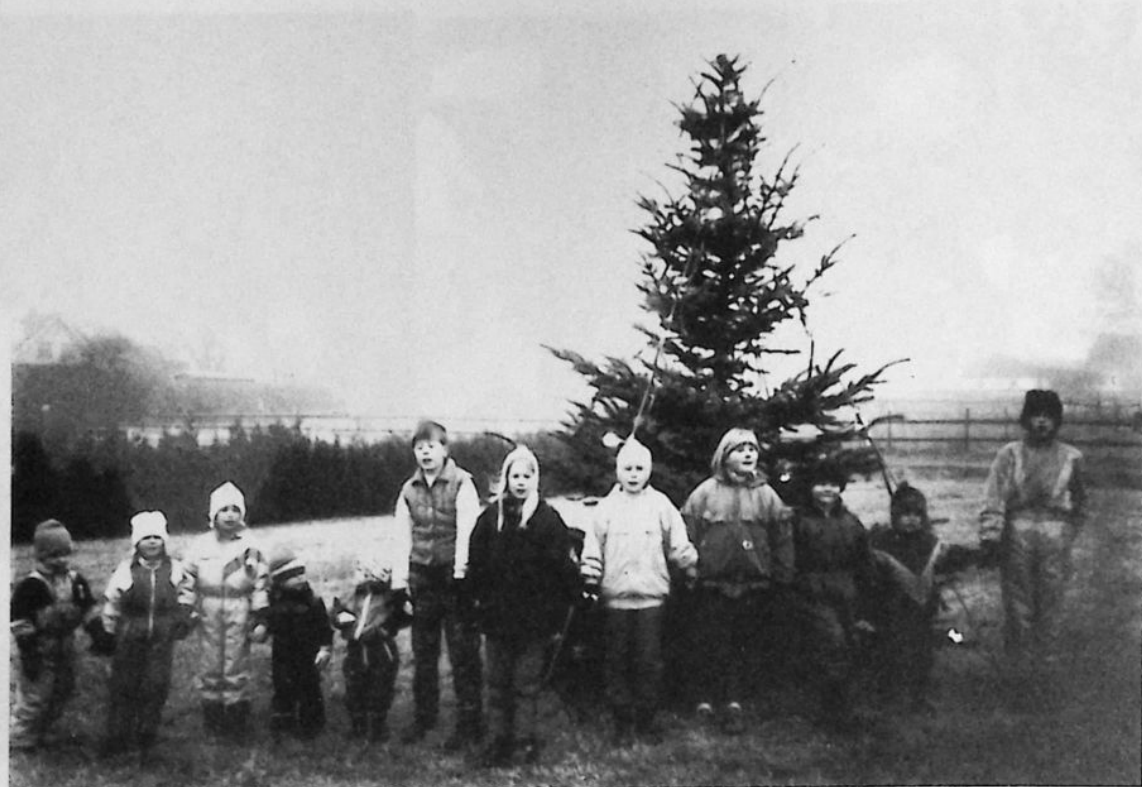
Dans kring granen i Starrarp.