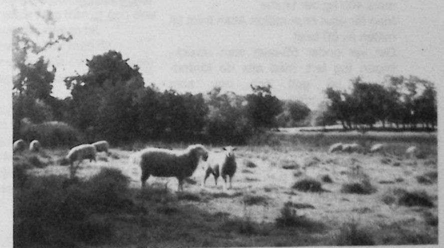
Liksom sista sommaren med fåren på bete.