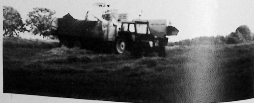
Sluttröskat för Allan.