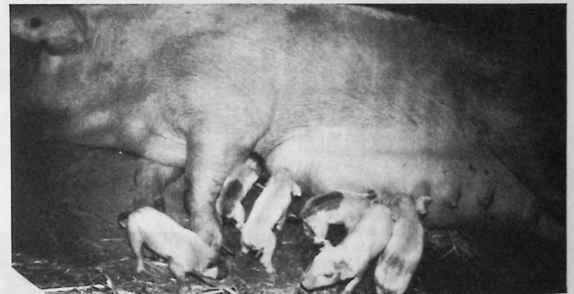
och sista smågriskullen har också förevigats.