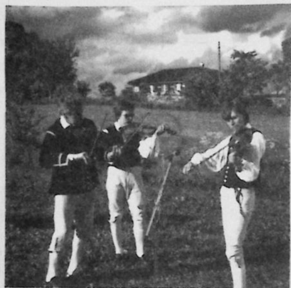
Färsingagilletts spelmän spelar "Skumpamarschen"