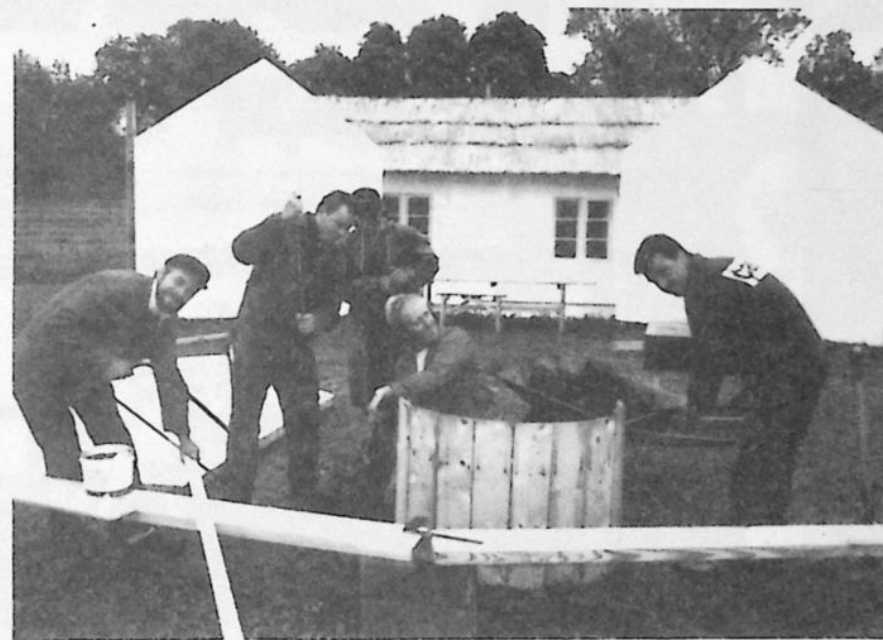
Här börjar kulisserna ta form, men målning återstår.