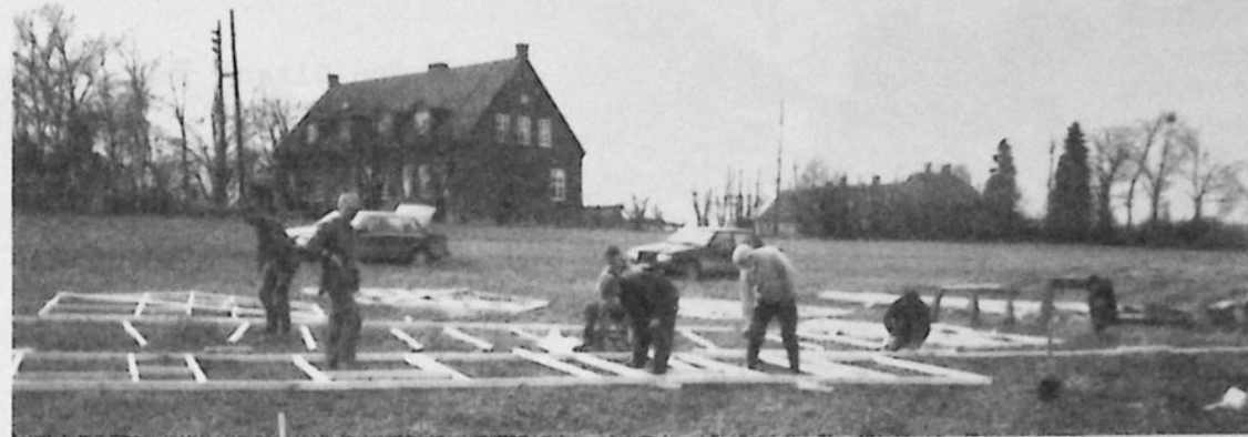
I slutet av mars påbörjades arbetet med kulisserna.