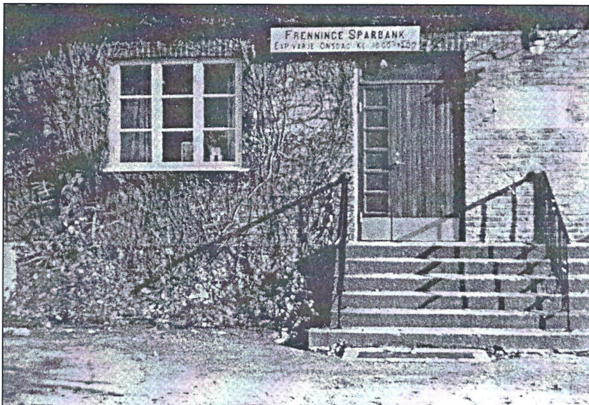
Sparbankens expedition i Frenninge skolhus åren 1931 - 1964.