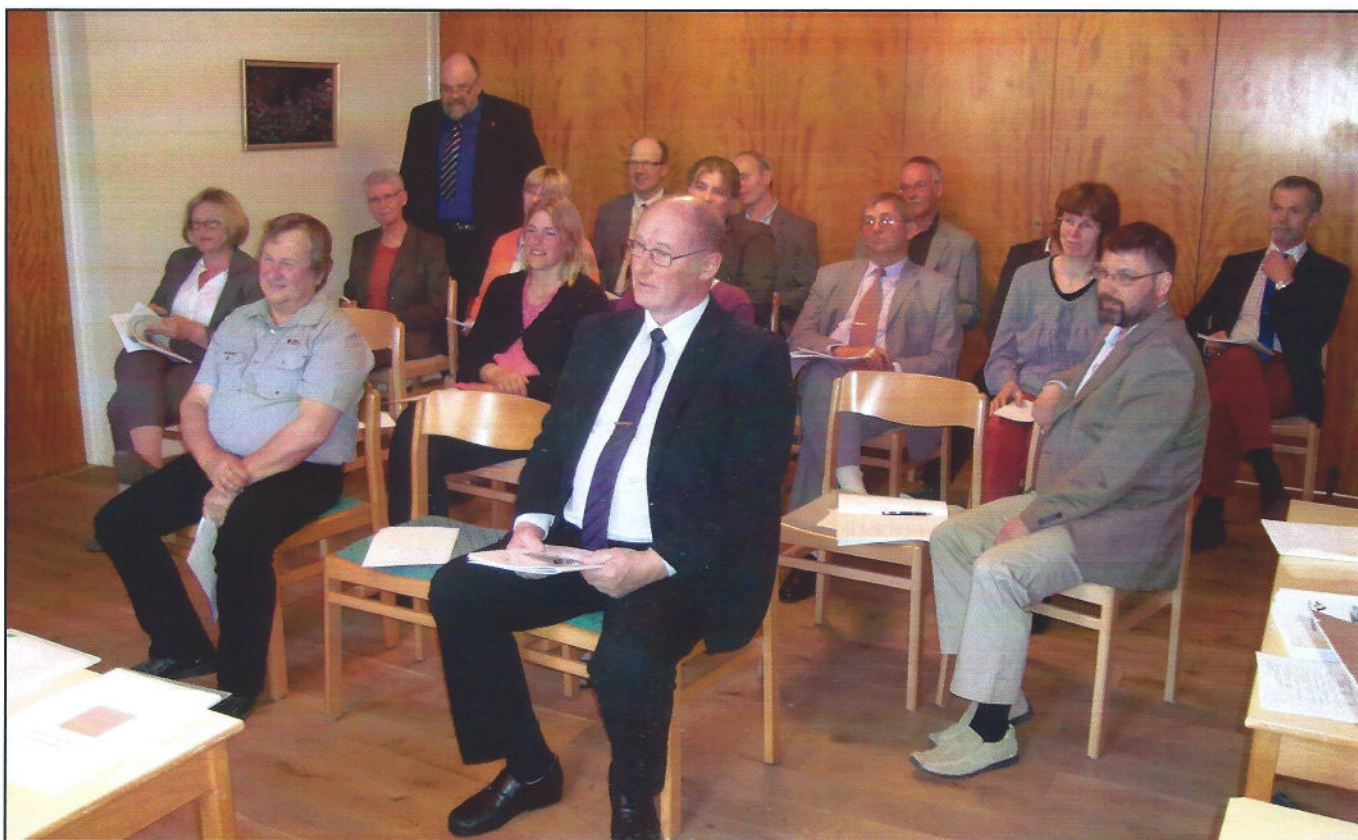
Årsmöte med huvudmännen på Ågården den 3 maj 2012.