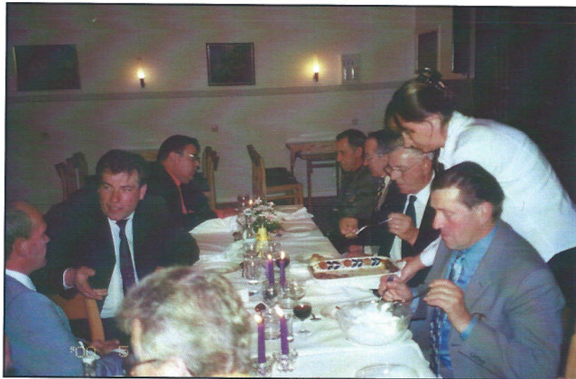
Huvudmannamiddag år 2000.