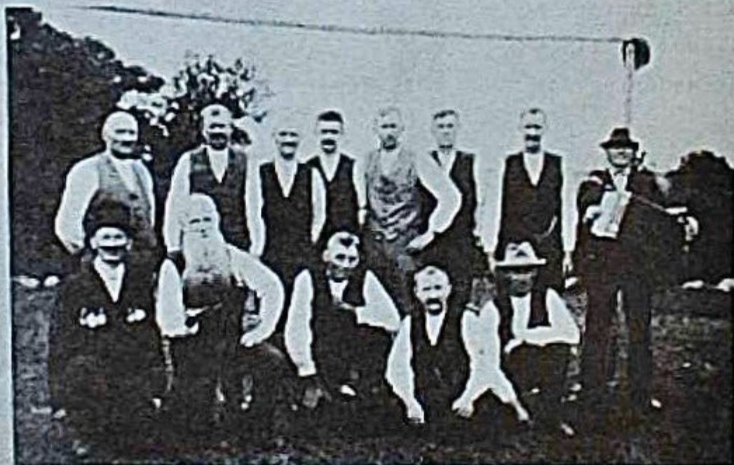
Starrarps "gubbalag" 1929