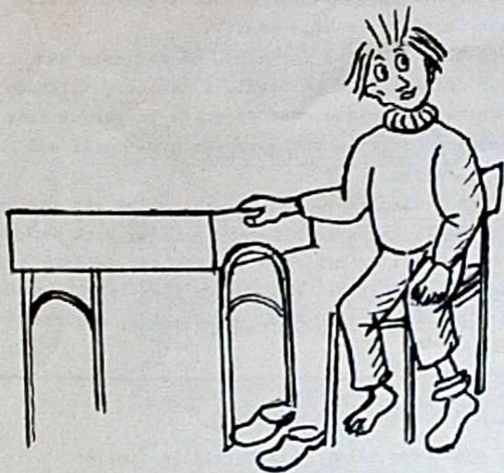
Teckning: Anton Håkansson

Det blir SYFÖRENINGSAUKTION i Starrarps skola