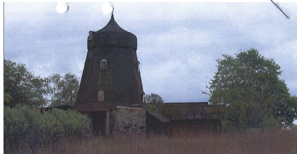
Kvarnen i Årröd