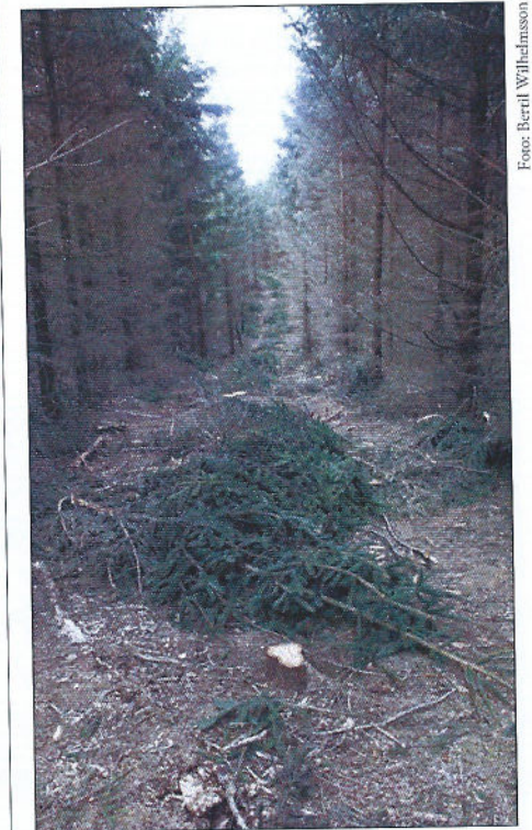
Utsikt från Galgebacken

Under denna väntan hade jag god tid att göra allvarsamma betraktelser. Jag försökte sätta mig in i kvinnans belägenhet och jag kände då mycket underligt inom mig... Somliga sa att hon var väl förberedd, andra