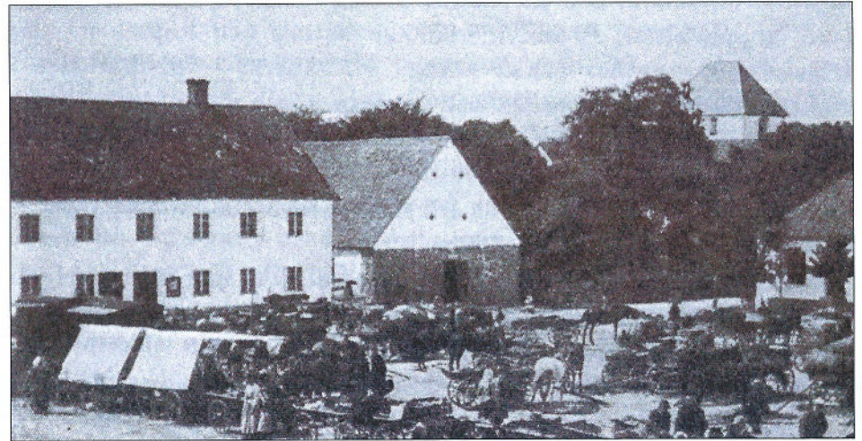
Marknad i Hörby 1890

beredd att gå döden till mötes. Hon svarade ja utan minsta tvekan eller villrådighet, och gjorde sig i ordning för resan mot avrättningsplatsen. Under vägen dit förblev hon lugn och vid ankomsten till platsen, gick hon lugn "och med verklig beundransvärd styrka och sinnesnärvaro mot stupstocken, för att böja sitt hufwud under bödelns bila" .