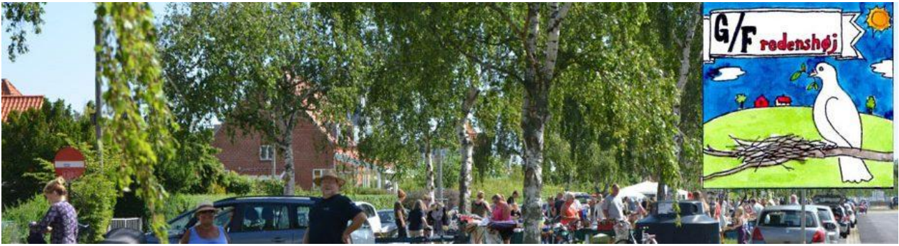
Grundejerforeningen Fredenshøj, ordinær generalforsamling 25.02.2025, Skolen ved Sundet