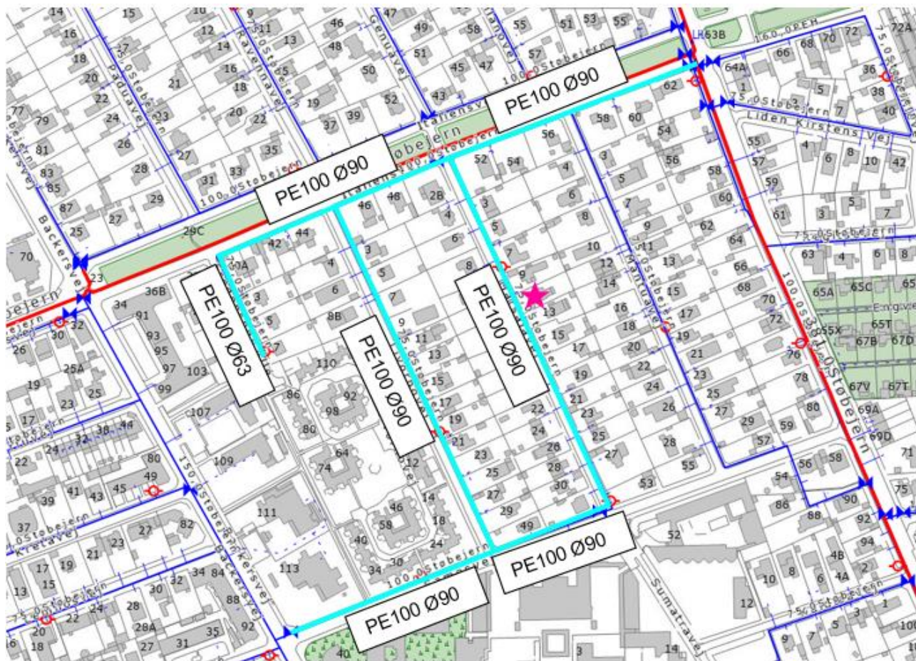
Figur 1 - Planlagt renoverede ledninger m. nye dimensioner og materialer

Ventilplacering er aftalt med Thomas Tofft fra Vand Drift. Brandhaneplacering koordineret med Ulrik Bjelbæk fra Hovedstadens Beredskab.