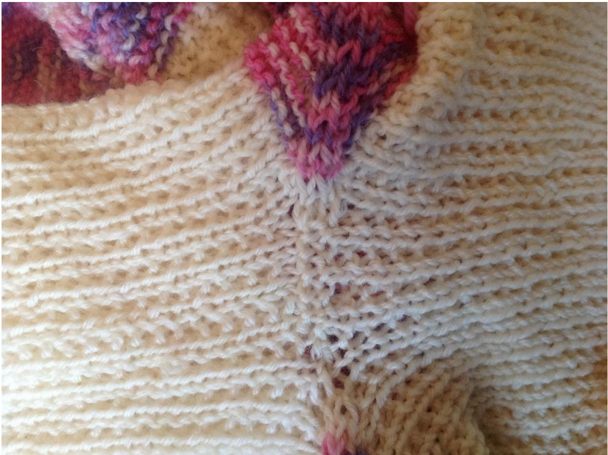
Bilde 4: Søm under ernet.