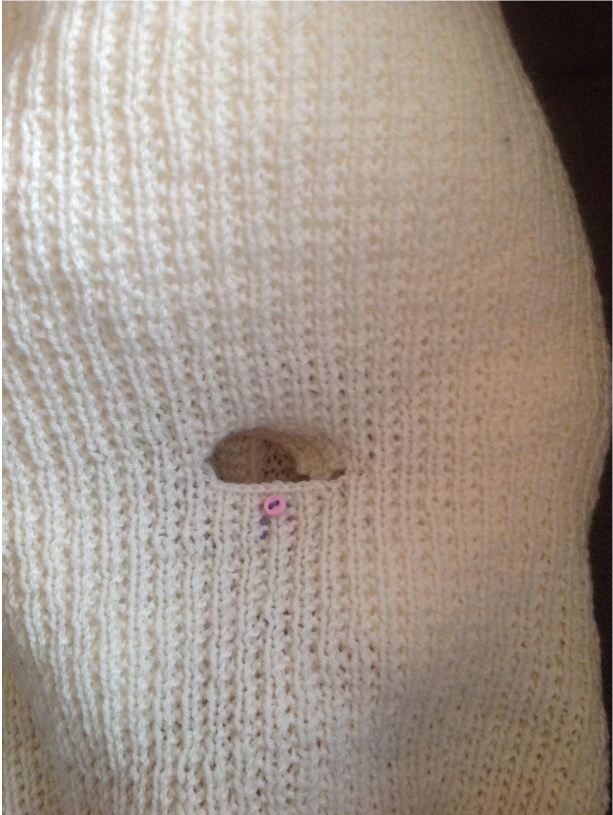
Bilde 5: Jeg har heklet en liten klaff og brukt en liten knapp, for å skjule hullet når selen ikke brukes.