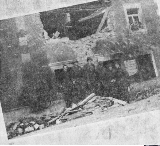
An der "Unit History", also der geschichtlicher Dokumentatioun vun dem 104. Regiment, hunn d'Jongen hire Papp