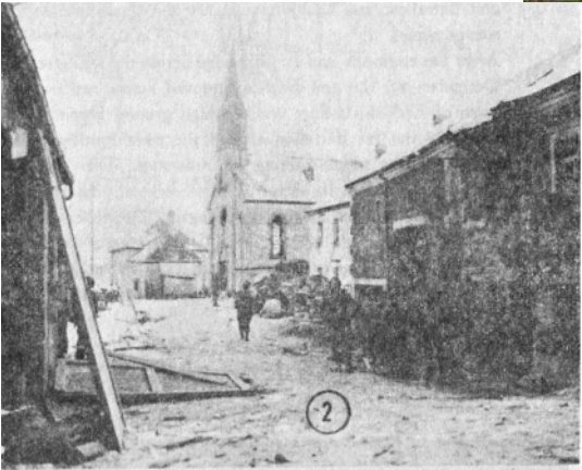
erkannt, deen op der Foto mat engem aneren Member virum Gefechtsstand vum 2. Batailloun poséiert huet.