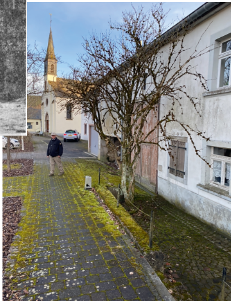
Ouni mat der Wimper ze zucken, hunn si dunn onse Veräin kontaktéiert a wollte