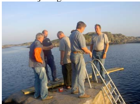
Bilden: Delar av samhällsföreningens medlemmar monterar badstegar våren 2007.

Fotö Samhällsförening är en politiskt och religiöst obunden förening som driver frågor och aktiviteter av intresse för Fotös befolkning. Listan på de saker samhällsföreningen har åstadkommit kan göras lång och vi hoppas att driva verksamheten vidare med kraft. För detta behöver vi så många medlemmar som möjligt (glöm inte att betala medlemsavgiften, inbetalningskort finns i postrummet) och så många deltagare som möjligt i våra olika aktiviteter. De som vill engagera sig mera är hjärtligt välkommen att kontakta någon av oss i styrelsen.