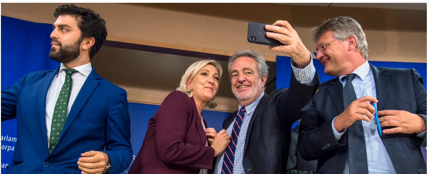
Højrefløjgruppen ID holder pressemøde.

Ifølge en meningsmåling fra The European Council on Foreign Relations (ECFR) fra januar 2024, står ID-gruppen til 98 medlemmer efter valget.