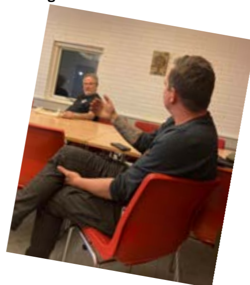
Møder i Horsens (Venstre) og Faxe (Højre).