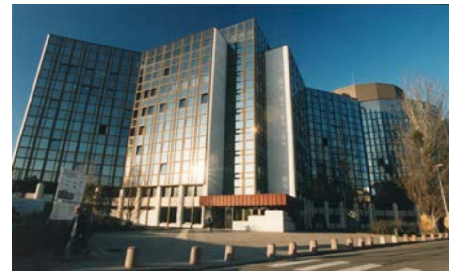
EU's Salvador de Madariaga-bygning som måske skal blive hotel.

Efter Storbritannien forlod EU, kan EU ikke længere prale af at have 28 medlemslande. Snart kan EU-Parlamentet dog måske prale af at have 28 bygninger.