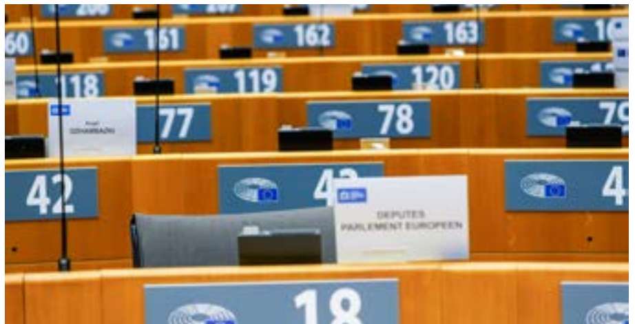
Tomme stole i EU-Parlamentet.

Efter det nyligt afholdte folketingsvalg blev der for alvor skiftet ud på pladserne i EU-Parlamentet.