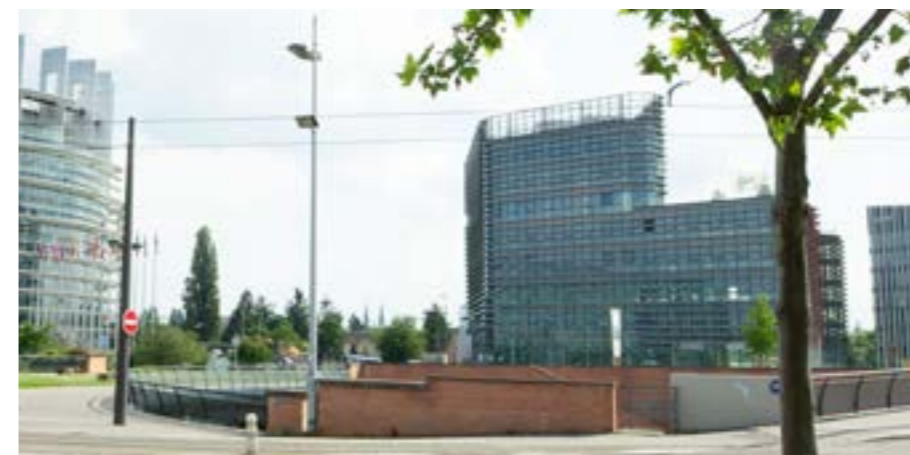
Osmose-bygningen, som nogle i EU gerne vil købe, ligger over for EU-Parlamentets Weiss bygning.

Det er næppe realistisk, at rejsecirkuset droppes lige foreløbigt. Kravet vil dog helt sikkert rejses, næste gang der er traktatforhandlinger.