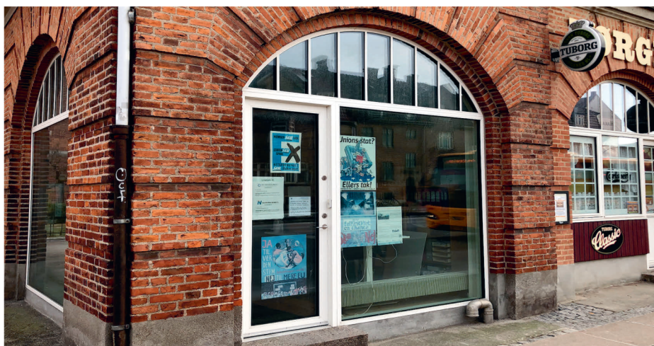
Landssekretariatet på Lyngbyvej.

Selvom COVID-19 fik aflyst langt de fleste aktiviteter sidste år, har vi på Folkebevægelsen mod EU's Landssekretariat alligevel haft rigtig meget at se til, og der er en masse spændende nyt at berette.