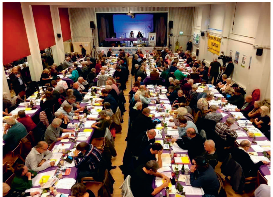
Det velbesagte landsmøde i 2019.

Viser det sig, at det heller ikke i oktober 2021 bliver muligt at afholde et landsmøde under mere eller mindre normale