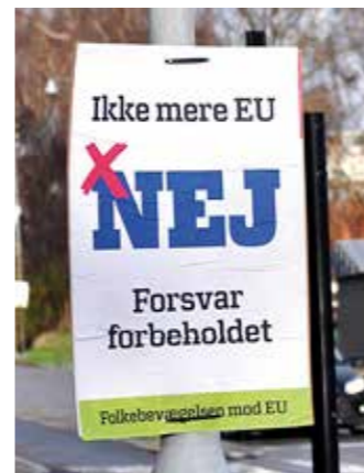
En aktiv stemme mod EU.

En stemme på Folkebevægelsen mod EU er din stemme mod EU.