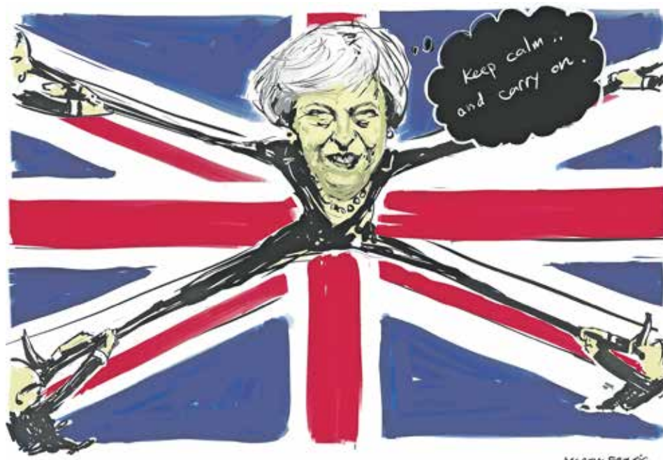
Vi skal lære af det kaotiske forløb med Brexit.

Uden for EU kunne Danmarks andel af regningen i stedet være brugt på global udvikling og klimatiltag, der ville bidrage mere til en fredelig verden, end EU-støtte til våbenindustrien gør.