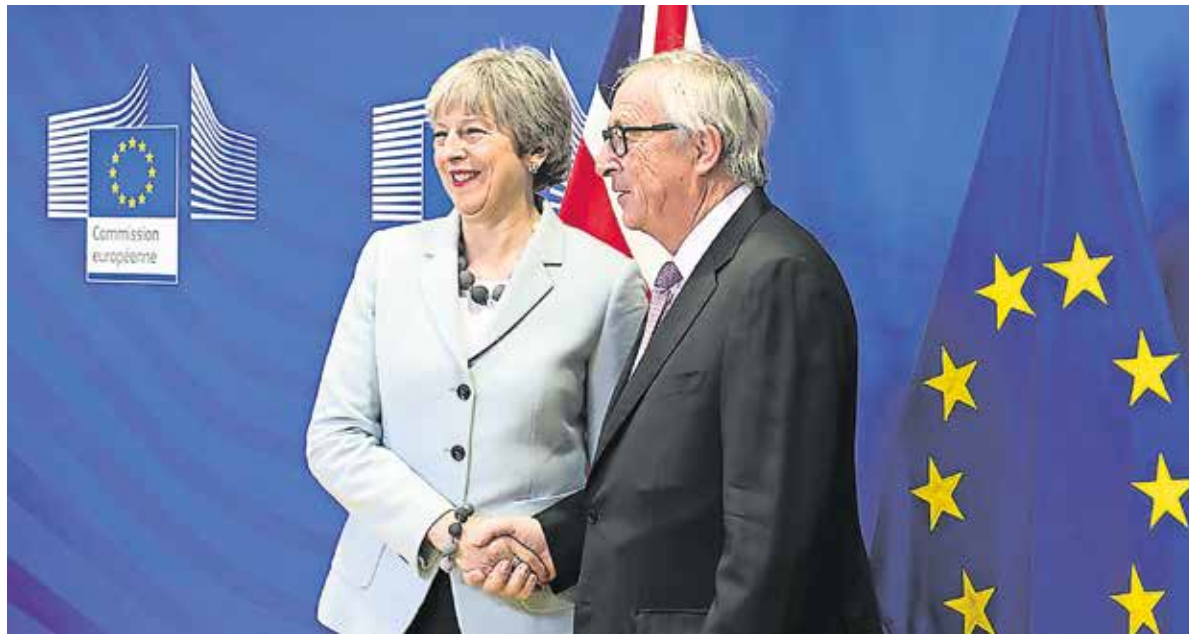
Storbritanniens premierminister Theresa May og EU-kommissionens formand Jean-Claude Juncker.

"Briterne har klart tilkendegivet at ville ud af EU – men hverken EU eller den britiske regering vil rigtigt lytte. EU har reelt ikke ønsket at lytte til den britiske befolkning, men har hele vejen arbejdet for, at det ikke skal være attraktivt at mel-