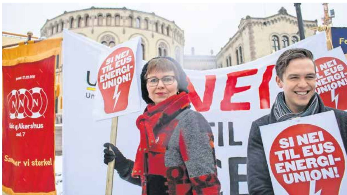
Nei til EU mener, at den norske stat har afstået suverænitet til EU

Det er højst usikkert om Nei til EU faktisk vil kunne vinde sagen, da det