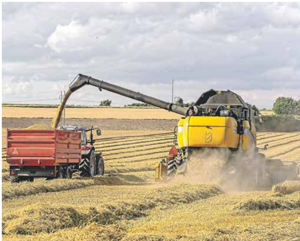
EU skal have ny landbrugspolitik og støtteordning efter 2020.

Konsekvensen er mange kontrolbesøg og problemer med retssikkerheden, fordi der er mange skøn. Eksempelvis frygter mange kvægavlere kontrol. For hvordan vurderer en kontrollant eksempelvis, om græsdaekket på en eng er "lavt og jævnt"?