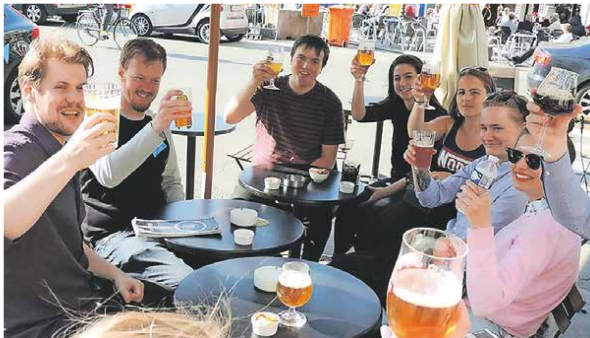
Der blev tid til lidt hygge midt i et hektisk program.

Derefter mødte vi MEP Miguel Viegas fra det portugisiske parti