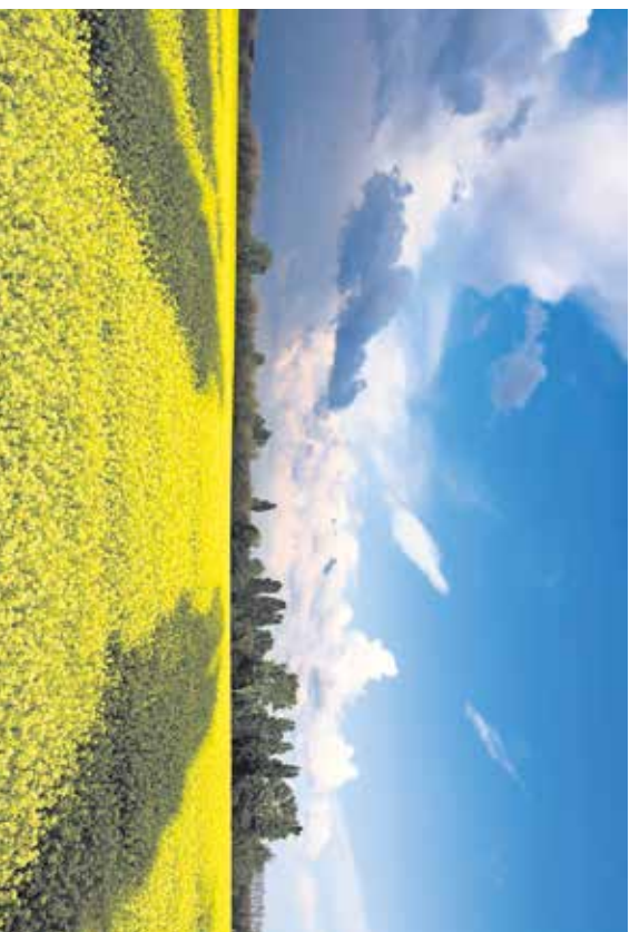
EU's nye landbrugspolitik kan koste Danmark dyrt.

Ifølge Kommissionens udspil er det således hensigten, at medlemsstaterne