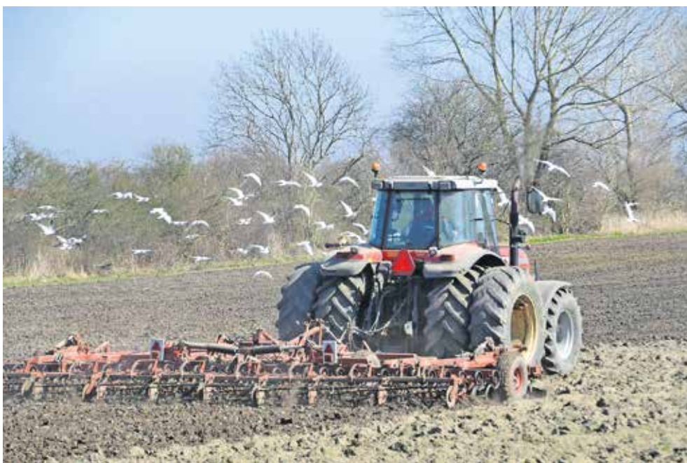
Landbrug & Fødevarer mener, at EU har været til gavn for dansk landbrug.