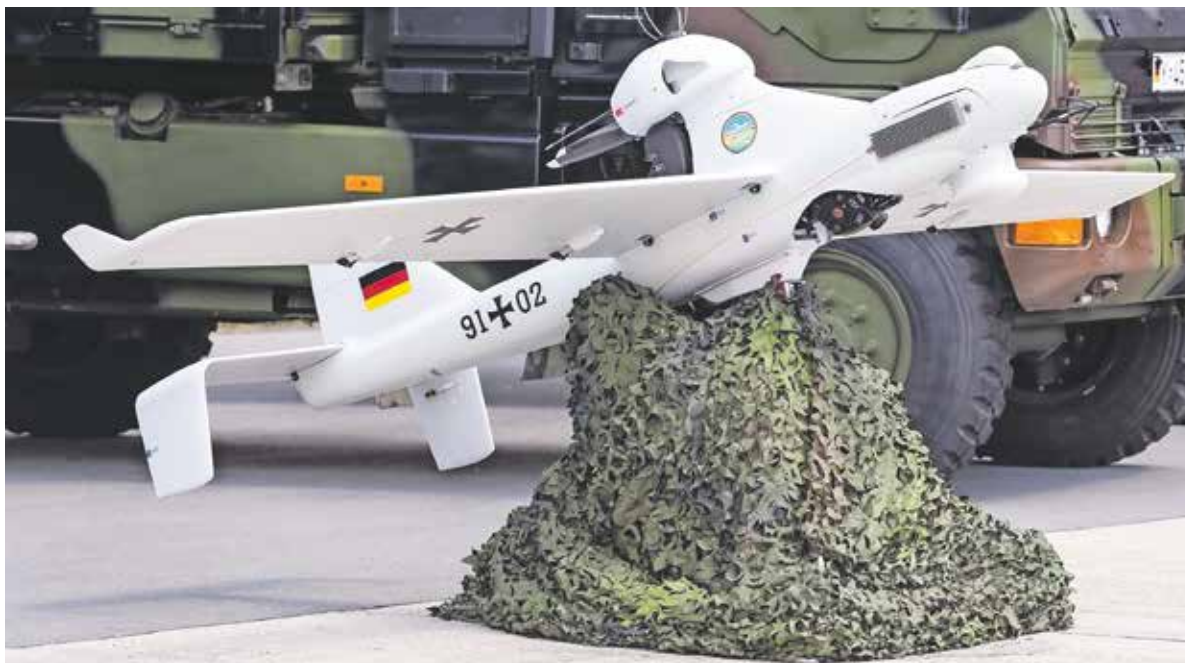
EU vil bruge millioner af euro på at udvikle militære droner.