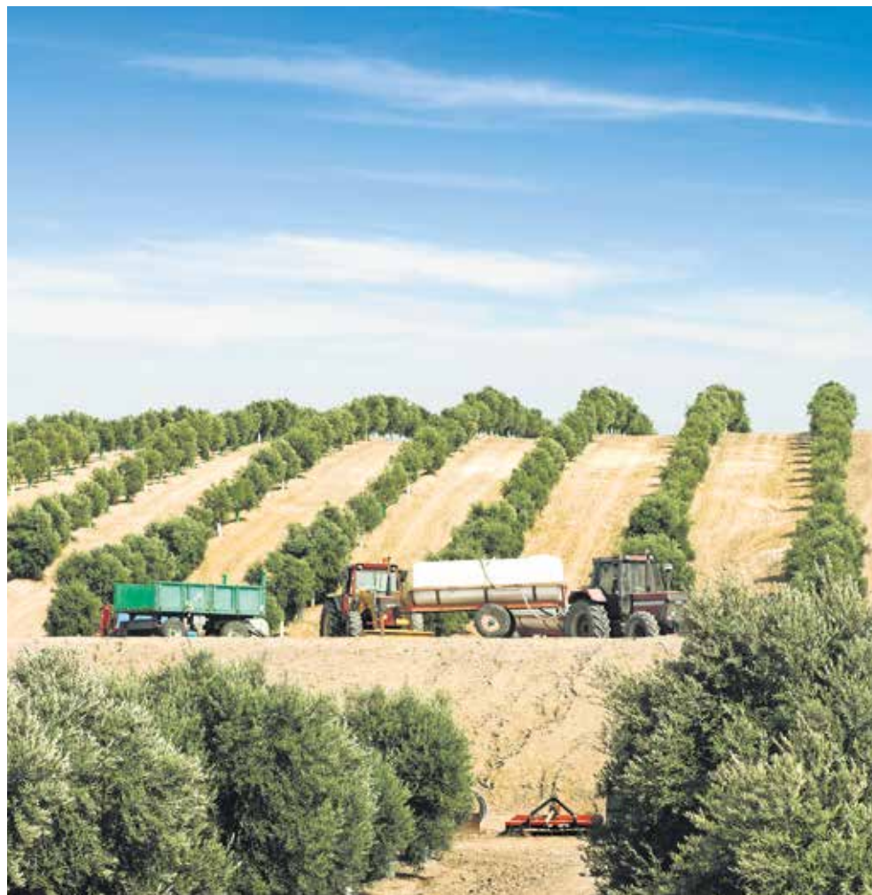
EU's landbrugsstøtte har i perioder medført overproduktion. Her olivenmarker.

Ligeledes er EU's landbrugspolitik et eksempel på, hvordan EU forårsager enorme samfundsændringer. Landbrugsstøtten er gået fra direkte indkomststøtte til en såkaldt "afkoblet" arealstøtte, hvilket har medført, at støtten har kapitaliseret sig i høje jordpriser. Dette har medvirket til at forstærke bevægelsen fra mange små brug til få store brug. Det er en tendens vi kender fra Danmark, men det