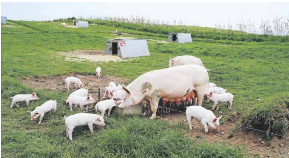
Antallet af fuldtidslandbrug er faldet fra 14.000 til 10.000 i Danmark siden 2010.

Når jordprisen er høj og priser på afgrøder lige så, bliver der fokus på at få alle marginerne med. Høje jordpriser giver øget gældsætning, som presser landmænd til at forstærke brugen af kemi og gødning, samt til øget effektivisering af maskineri og animalsk produktion - med deraf følgende problemer med