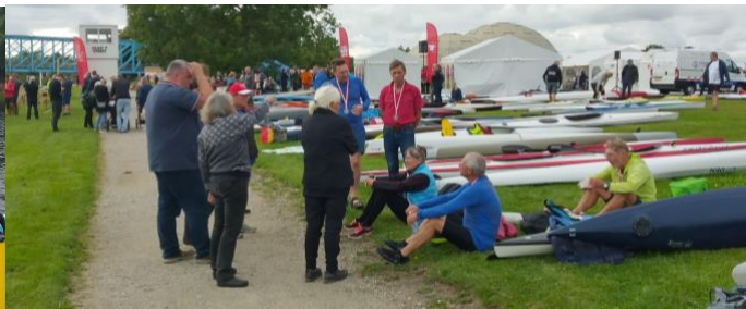
Pyha det var hårdt