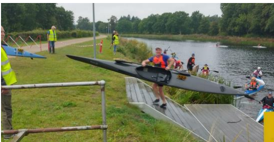
Lassen bærer over i Tange