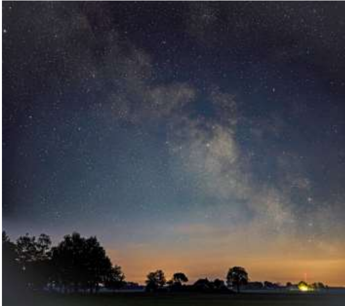
De Melkweg boven de Vogelrijd.

Het is Juli en daarmee nog steeds "Galaxy tijd" boven Fochtelloo. Helaas, de tijd om er naar te kijken is maar kort. De zogenaamde Astronomische duisternis bedraagt maar net twee uur, zo ongeveer van 0.00 tot 02.30. Daarvoor en daarna licht de zon de horizon al weer op. Dat betekent niet dat je voor die tijd