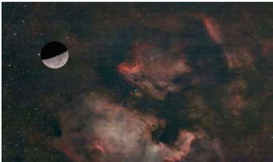
In Cygnus de Pelikaan en Noord-Amerika nevel. Daarbij onze maan in gelijke grootte.

moet worden uitgezet en de belichtingstijd wordt ook handmatig ingesteld. Knop dus op bijvoorbeeld AE, TV, M of B zetten. Je wilt veel licht ontvangen dus je sluitertijd blijft lang open staan. Een belichtingstijd van tien tot