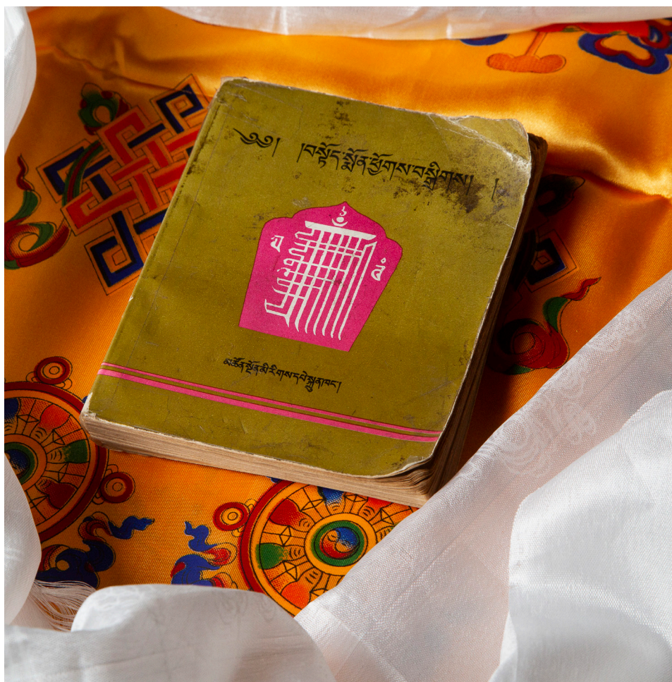
Foto boven: Een boeddhistisch gebedssnoer wordt gebruikt om de tel bij te houden bij het bidden of reciteren van mantra's. Het bestaat uit 108 kralen. Foto onder: Tibetaans gebedenboek.