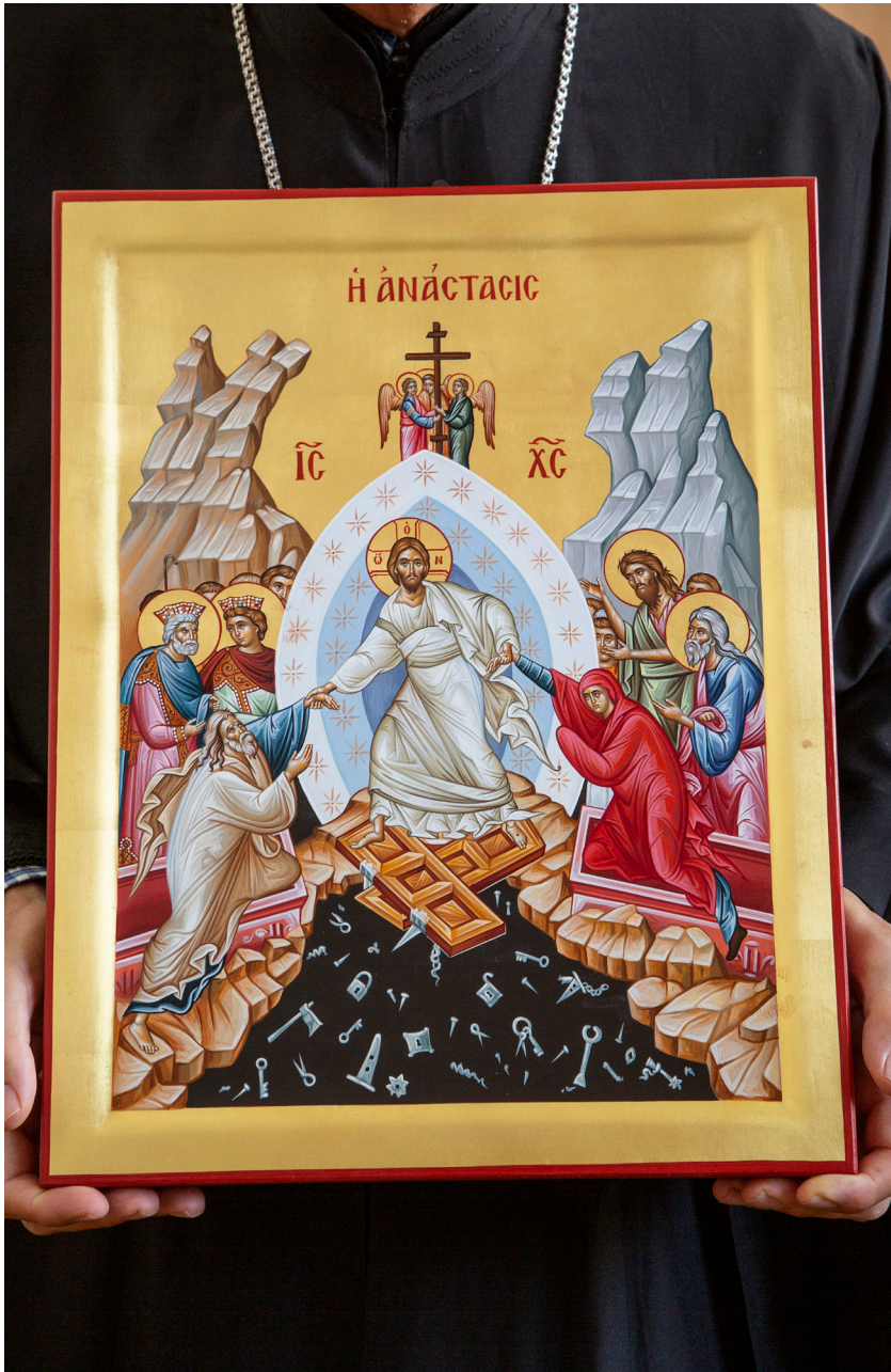
Foto: Icoon van de verrijzenis. Tijdens de Dienst van de Overledenen ligt het op de kist. Op het einde van de dienst geven alle aanwezigen een afscheidskus op het icoon.