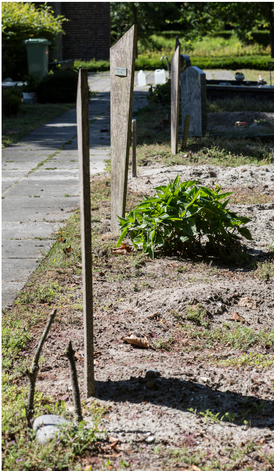
Foto: Op een graf wordt geen deksteen gebruikt, hoogstens een omranding die aangeeft waar de overledene ligt. Een eenvoudige grafzerk kan wel, verder niets. Iedereen is immers gelijk in de grond, arm of rijk.