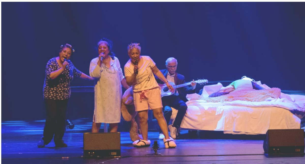
Bayke fotografie Zaans Zilver

Het programma Vrije Tijd & Amateurkunst richt zich op alle inwoners van Zaanstad die actief bezig zijn met creatieve activiteiten. Of zij nu les hebben bij een netwerkdocent of ergens anders, lid zijn van een amateurvereniging of gewoon thuis bezig zijn met hun hobby. Doel daarbij is het voor iedere Zaankanter mogelijk te maken zijn of haar eigen culturele pad te volgen, zich waar mogelijk verder te ontwikkelen en zich te presenteren aan anderen.