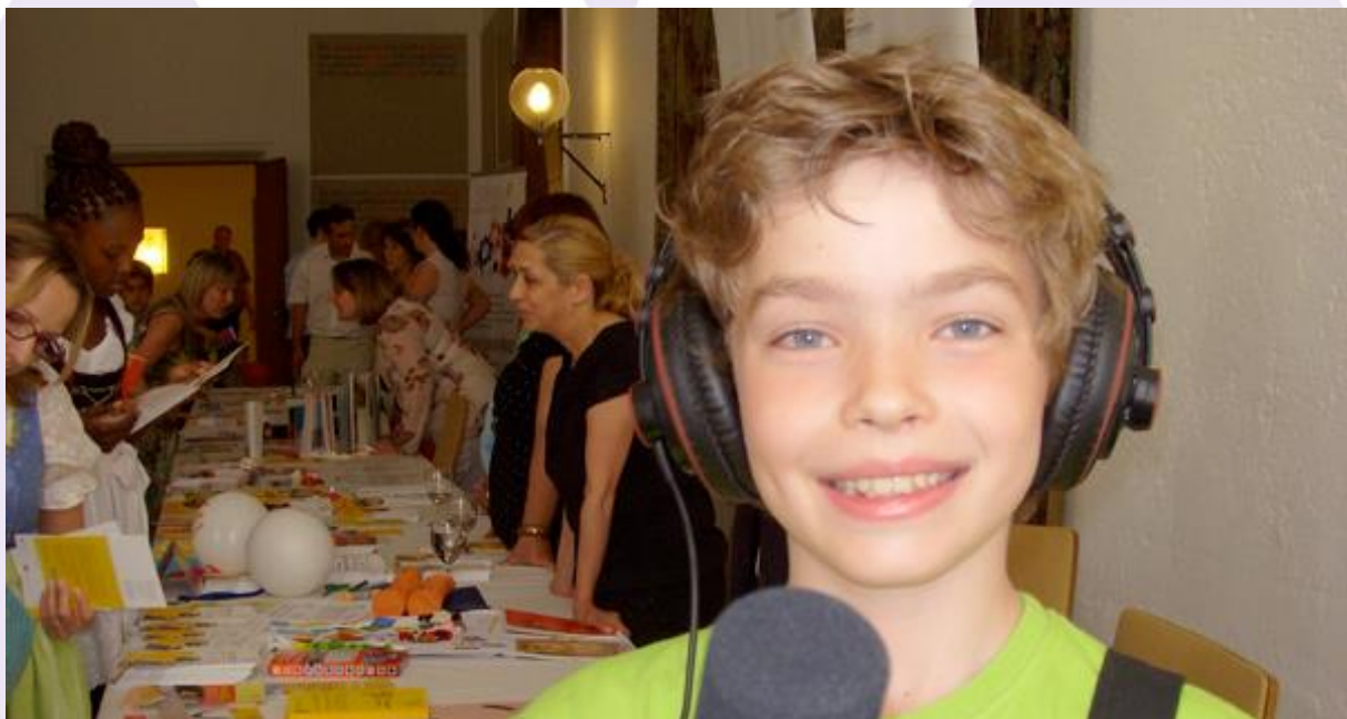
Fotografie Brede school / FluXus