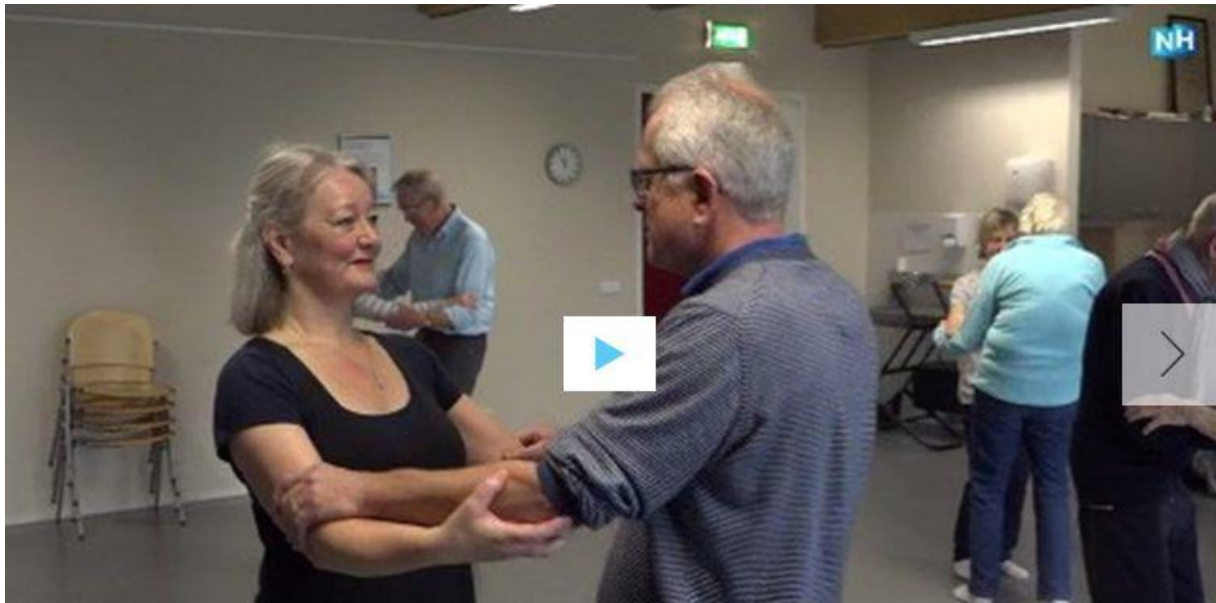
Still uit reportage over Dansen met Parkinson dat ook bij FluXus wordt gegeven

FluXus richt een expertisecentrum in voor cultuur in de wijken en de zorg; signalerend en verbindend. Daarbij werken wij samen met wijkregisseurs, accounthouders onderwijs, maatschappelijke instellingen en bewoners. Wij stellen een accounthouder Zorg & Welzijn aan. Deze accounthouder heeft nauw contact met wijkteams, zorginstellingen, maatschappelijke organisaties en cultuuraanbieders. Hij/zij signaleert maatschappelijke vragen en zoekt samen met professionals en bewoners naar artistieke oplossingen. Het expertisecentrum biedt Zaankanters en organisaties gereedschappen om hun initiatieven zelfstandig of met anderen te realiseren en duurzaam te verankeren.