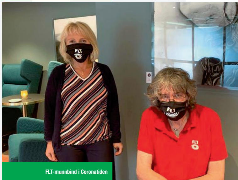
FLT-munnbind i Coronatiden