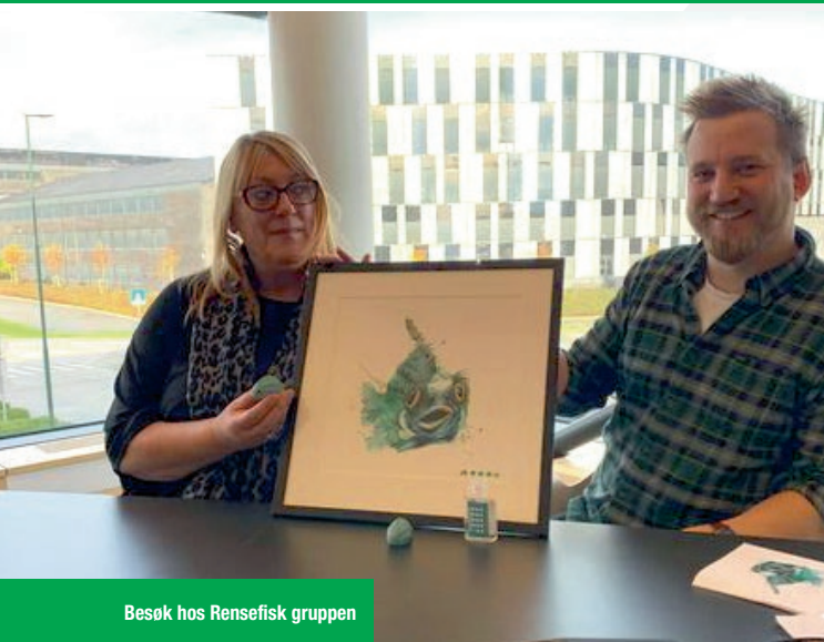
Besøk hos Rensefisk gruppen