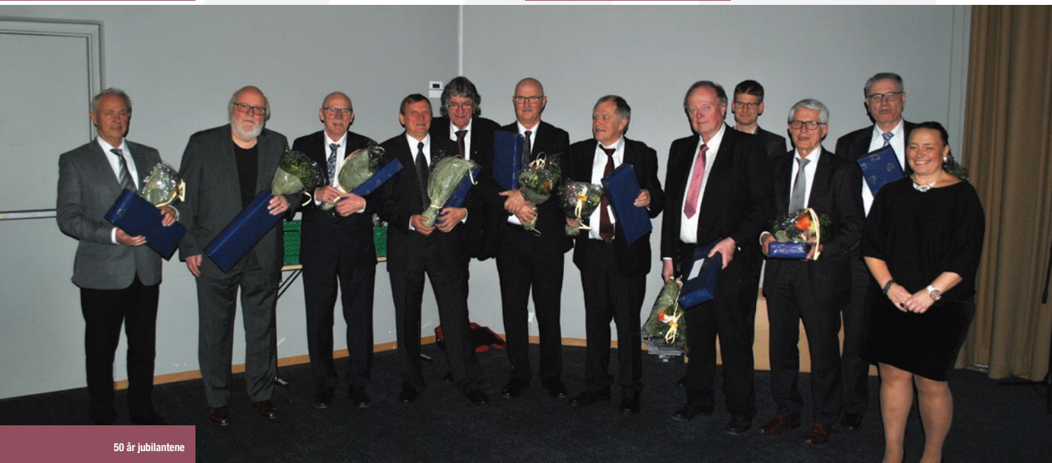
50 år jubilantene