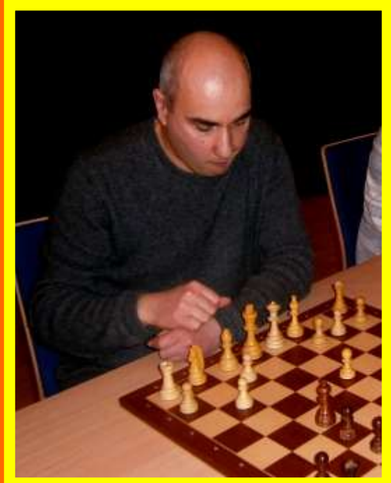
Artur Kevorkov Stadtmeister Blitzschach 2017