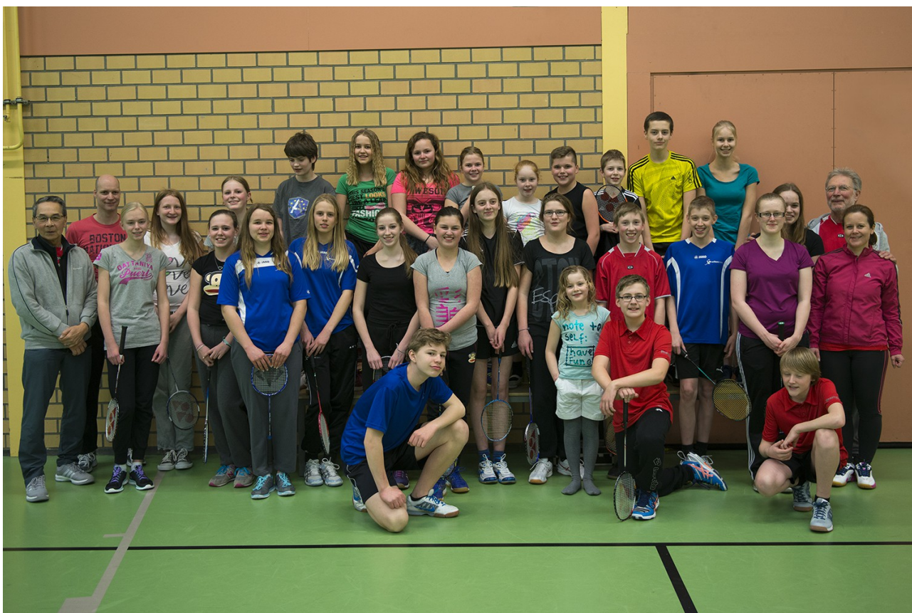
Foto jeugd