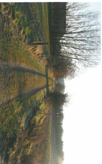
Banestien mod Havndal

Mariager Den lille og meget charmerende købstad Mariager, rosesnes by, ligger ikke på Nordsøstien, men er afgjort en af fjordens perler. Foruden selve byen med dens bindingsværkshuse og brolagte gader er Alstrup Krat samt bronzealderthøjen Hohøj et besøg værd.