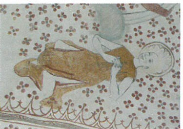
Kalkmaleri i Sødring Kirke

Fra Udbyhøj Vasehuse går der hele tre parallelle veje ind til kystskrænten ved Demstrup Huse, og herfra går det nordpå langs kystskrænten og i et sving op omkring herregården Demstrup , før man nord for avlsgården fortsætter langs skrænten.