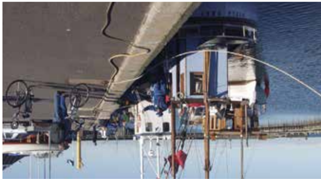
Asaa Aktivitet på havnen i Sæby

For enden af Algade, nord for åen, ligger Sæby Mølle. Anlægsesåret kendes ikke, men møllen eksisterede i hvert fald i 1640. Ved inddæmning er der skabt en møllesø, hvor den stille å opstemmes ved stemmeværket, for at blive ført ind til to store møllehjul, underfaldshjul, der i 1926 blev erstattet af en turbine. Fra 1805 var møllen igennem flere år i sægten Aabels eje. I 1938 blev møllen nedlagt og omdannet til snekker- og karetmagerværksted. Møllen er omfattet af bevaringsplanen fra 1968 og er i dag fredet. Havnen, der oprindeligt var en åhavn, var alfa og omega for Sæby. Det ses tydeligt ud fra byens toldregnskaber, at eksporthvervet var vigtigt. Men åhavnen sandede til, og nær det skete, kunne havnen ikke besjæles, hvilket igen fik atgørende indflydelse på byens økonomi. Efterhånden overtog fiskeriet Fladstrand, det senere Frederikshavn, rollen som områdets eksport- og importsted. I dag benyttes havnen først og fremmest af lystsejlere.