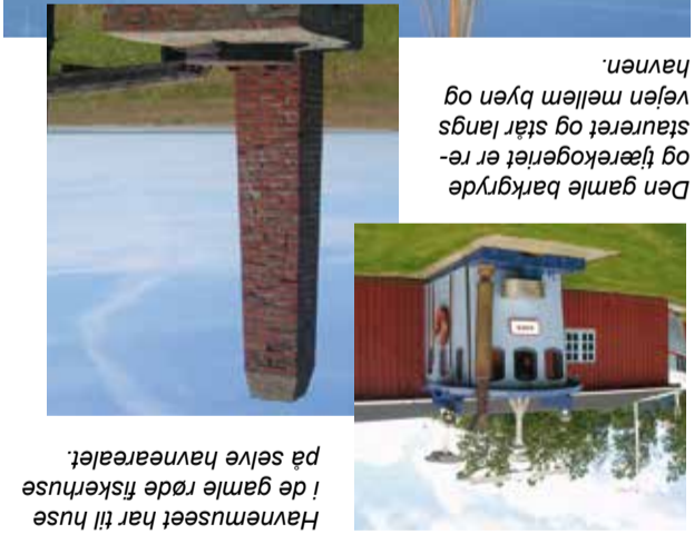
Havneuseet har til huse de gamle røde fiskerhuse på selve havneareal.

huset af sortlæret træ, opført 1959, stadig står ved havneindløbet. Tilslutningen af havnen medførte, at der syd for havnen opstod en kunstig badestrand, som blev et populært udluftsmål, da friluftsbadning blev moderne. Fra 1930'erne udløjede havnen pladser til badehuse. I dag står fortsat en række badehuse. Asaa Borgeforening, oprettet 1907, begyndte i 1927 at afholde hestevæddeløb. Det blev en stor succes og har været afholdt hvert år siden, kun afbrudt af besættelsen. I den lokale Turistinformation fra 1993 fortæller: "Ikke mange meter fra Asaa Camping ligger Asaa festplads, hvor der i mere end 50 år har været afholdt årligt hestevæddeløb - en festdag, der år efter år trækker tusinder af mennesker til byen". I dag afholdes Asaa marked samtidig med væddeløbet. Banen er ejet af borgerforeningen, der lige har bygget nye faciliteter.