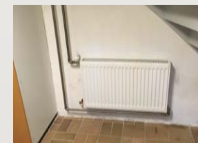
Opsætning af radiator.

Jeg slår din græsplæne med maskine, der passer til din græsplæne. Jeg kan også trimme arealer langs mure, bede og lign. eller kantskære din plæne alt efter din ønske.