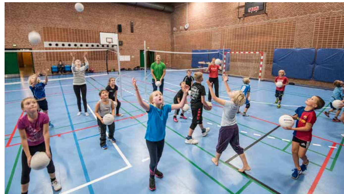
Kidsvolleyballspillerne fik lov til at udnytte pladsen på Buddinge Skole, og det lettede presset på nogle af de øvrige lokaliteter.

Når man skulle leje sportshallen på Vandtårnsvej krævede kommunen nu 3.000 kr. i depositum. FIG var ikke orienteret. Der skulle også betales 120 kr. i timen for leje af hallen. Bokseklubben havde fået en opkrævning på et stævne, der først skulle afvikles et halvt år