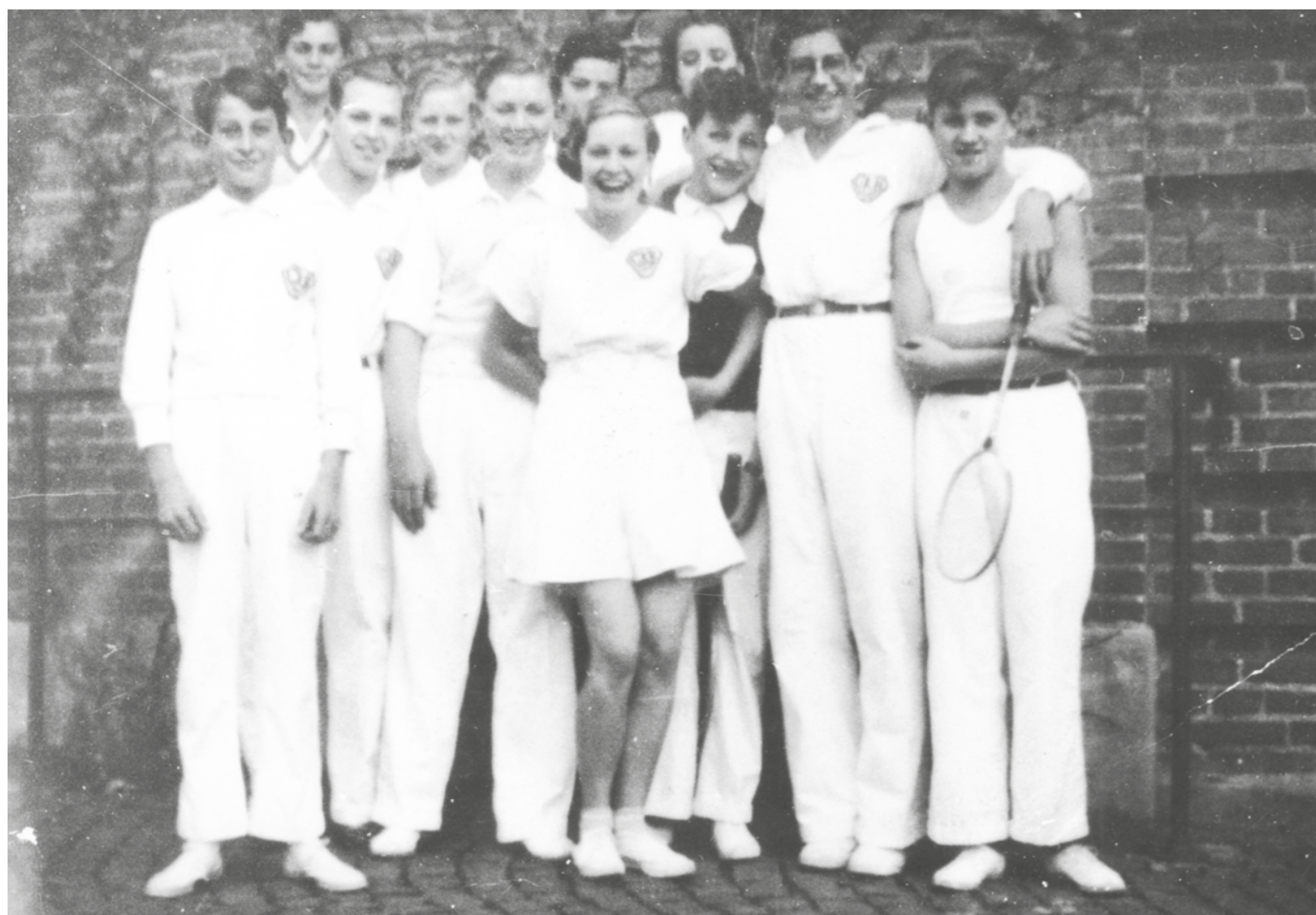
Gladsaxe Kommunes Badmintonklubs juniorhold i 1934. I 1934 spillede klubben både på Gladsaxe Skole og på Søborg Skoles ud over at de lejede sig ind på Søborghus Kro

I tiden med stor arbejdsløshed over hele verden bidrog idrætten i Gladsaxe ved at levere gratis konditionstræning til de folk, der ikke havde et arbejde at stå op til. Søborg Idrætsforening flyttede i 1935 sin atletiktræning til Københavns Stadion (Genforeningspladsen) tirsdag og torsdag aften samt søndag formiddag.