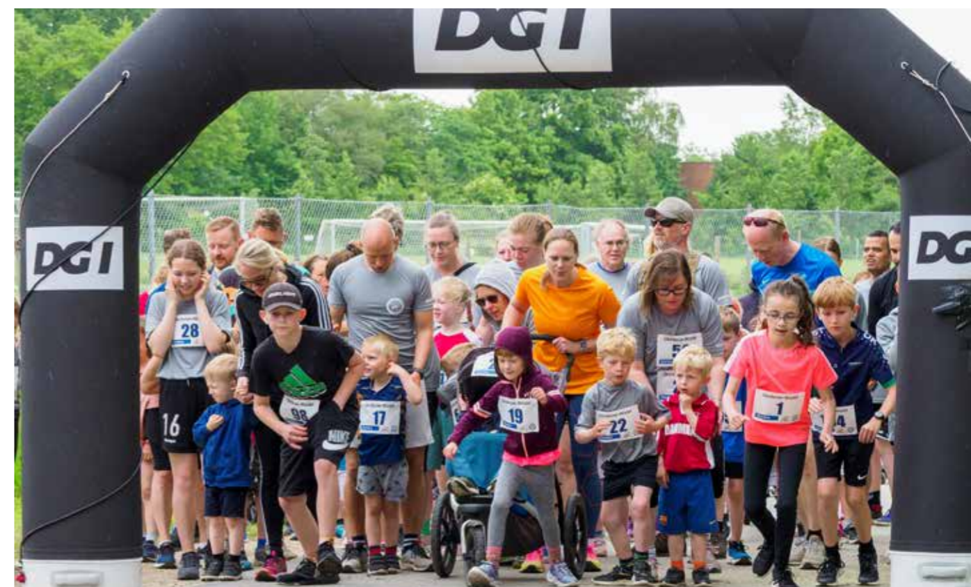
Gladsaxeløbet fik en fin start med 400 deltagere i det første løb, der blev afviklet ved Aktivcentret på Telefonvej.

I 2008 blev der udarbejdet en visionsplan for Bagsværd Sø med henblik på at gøre søen