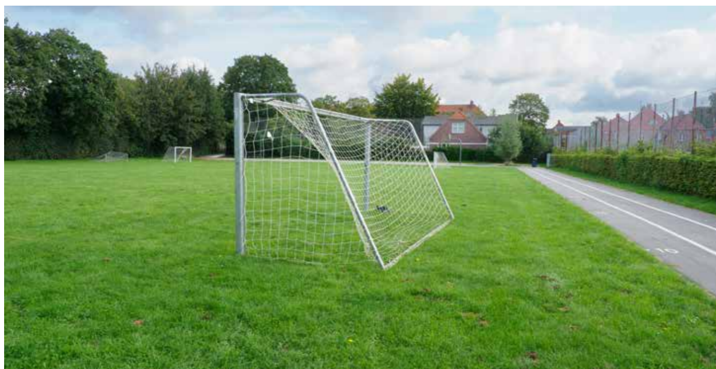
I over 100 år har det begrænsede areal på Wergelands Alle været brugt af tusindvis af skoleelever og idrætsfolk

Tidligere på året havde FIG sendt en resolution til sognerådet. Her fremførte man, at ungdommen måtte have krav på at få idrætsfaciliteter stillet gratis til rådighed. Det tog sognerådet til efterretning.