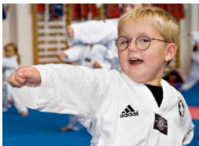
Mange nye sportsgrene er kommet til Danmark efter 2. verdenskrig og mange kampsporter med rod i Asien har vundet stor udbredelse. Det gælder også taekwondo i Gladsaxe.

Omklædnings- og badefaciliteter blev kraftigt forbedret i svømmehallen på Vandtårnsvej og bowlinghallen fik også en tiltrængt overhaling. Volleyballklubben VKV med de stolte traditioner skiftede navn til Gladsaxe Volleyball Klub, så det lokale tilhørsforhold blev understreget.