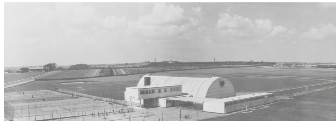
Den nyopførte hal på det nye stadion på Gladsaxevej ved Marielyst Skole, der også blev opført i den periode, lå noget for sig selv

I forbindelse med en ro-regatta på Bagsværd Sø var det nødvendigt med en "opmudring" og oprensning af banen. Gladsaxe Kommune og Dansk Forening for Rosport (DFFR) delte regningen på 2.202 kroner. DFFR bad om henstand med de sidste 600 kroner til næste sæson.