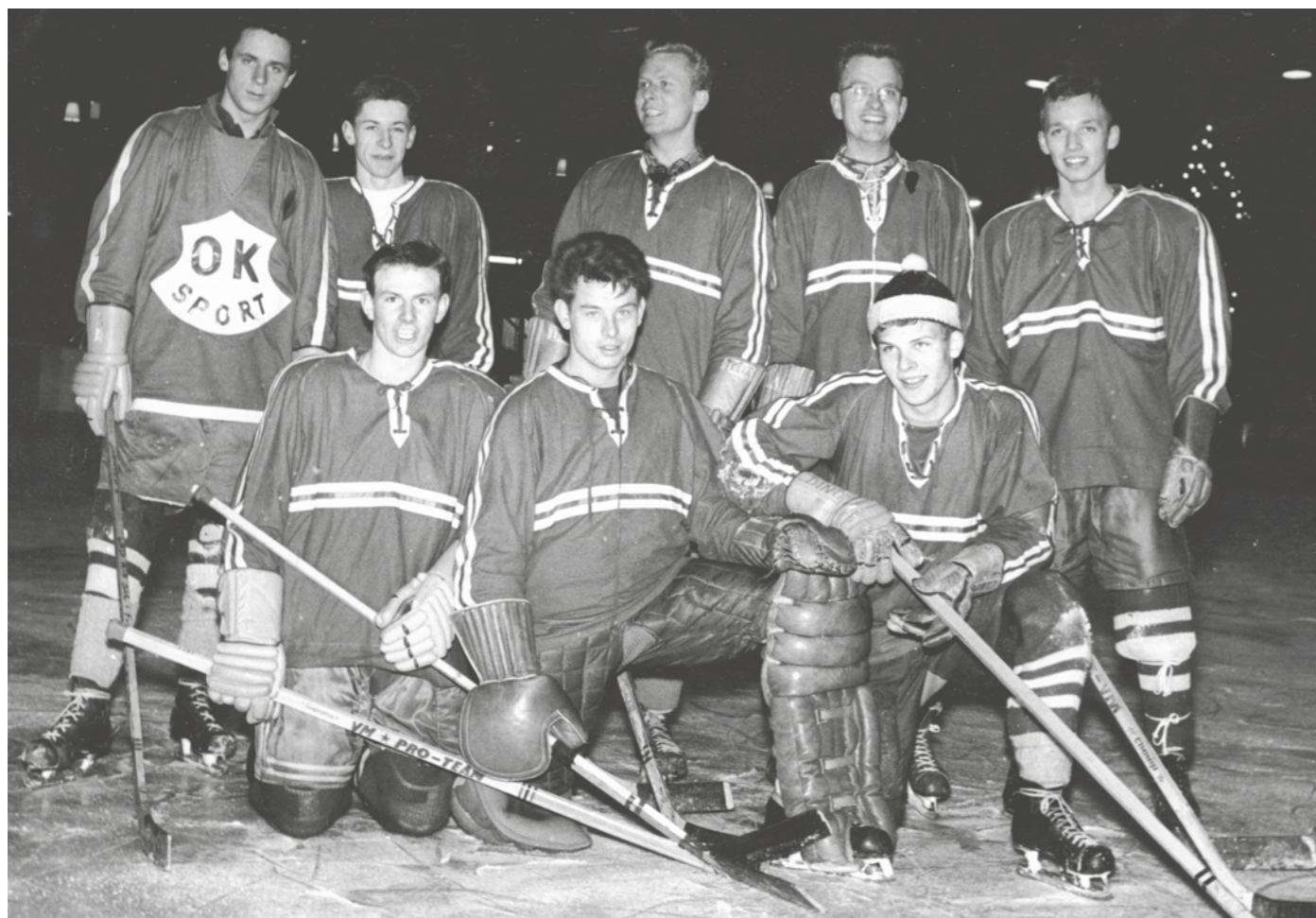
Der var virkelig pionerånd over etableringen af ishockeyklubben. En del af spillerne med tilhørsforhold til Søborg Skole havde stået på skøjter på en lille sø ved Gorkis Alle, men primitivt var det.

Bagsværd IF fik besked om, at en stor del af anlægget skulle lukkes i en længere periode, fordi hele græsarealet skulle renoveres. Det ville medføre en halvering af antallet af aktive, og man frygtede at 200 drenge ville drop-