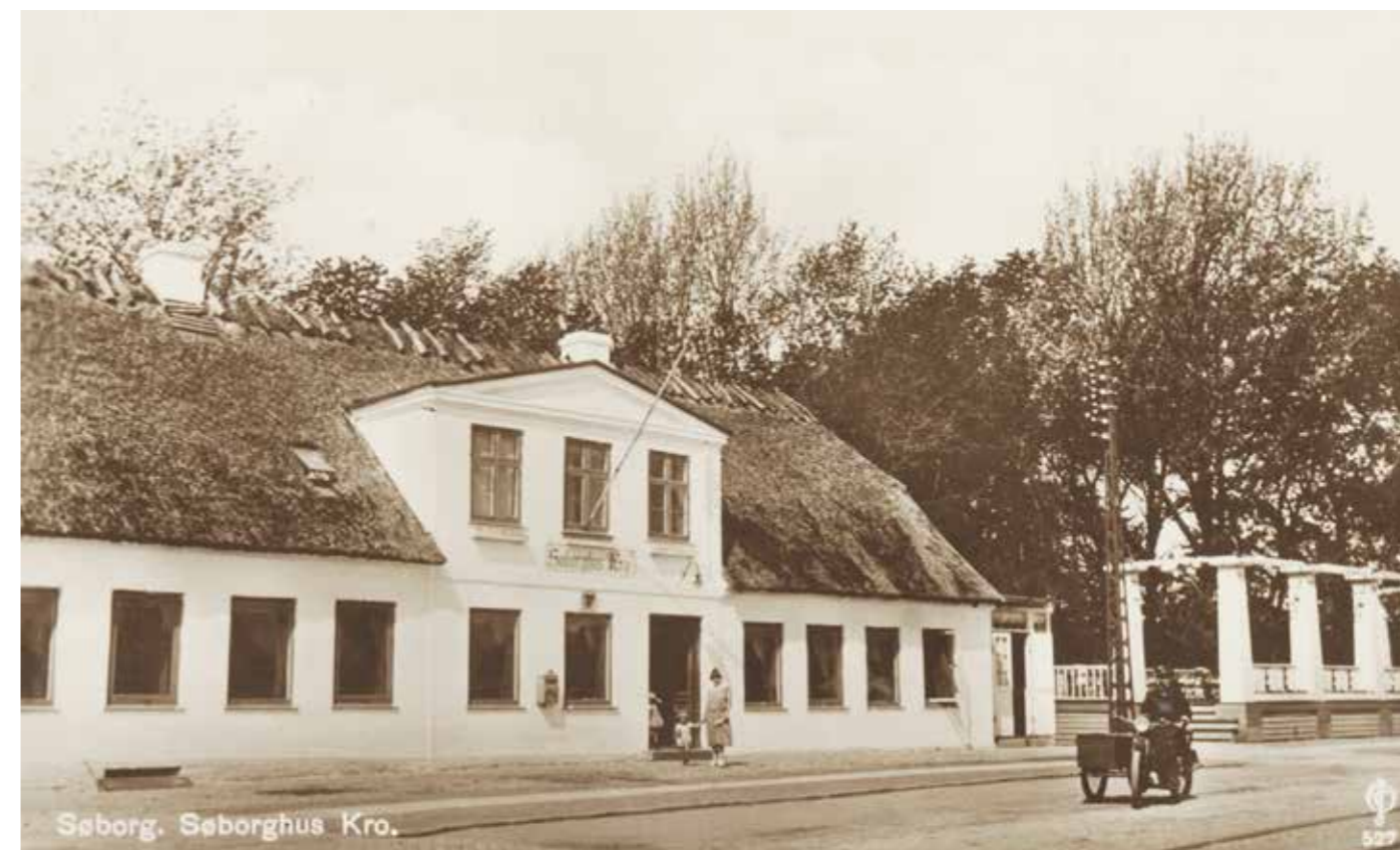
Når der nu ikke var haller, måtte man benytte sig af salene på de få, forskellige kroer, der var i området som f.eks. Søborghus Kro.

D.U.I. var voldsomt aktive op gennem 1920'erne og havde en bunke arrangementer. Det var nu ikke alt, der havde med idræt at gøre. Der blev spillet masser af musik og givet koncerter og sunget i kor.