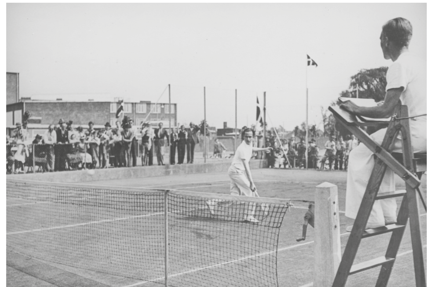
Tennis-spillet havde i mange år et ry for kun at være for de velstillede, og det så meget fornemt ud, når der som f.eks. her i 1940 blev spillet på banerne på det nye stadion med Marielyst Skole som baggrund.