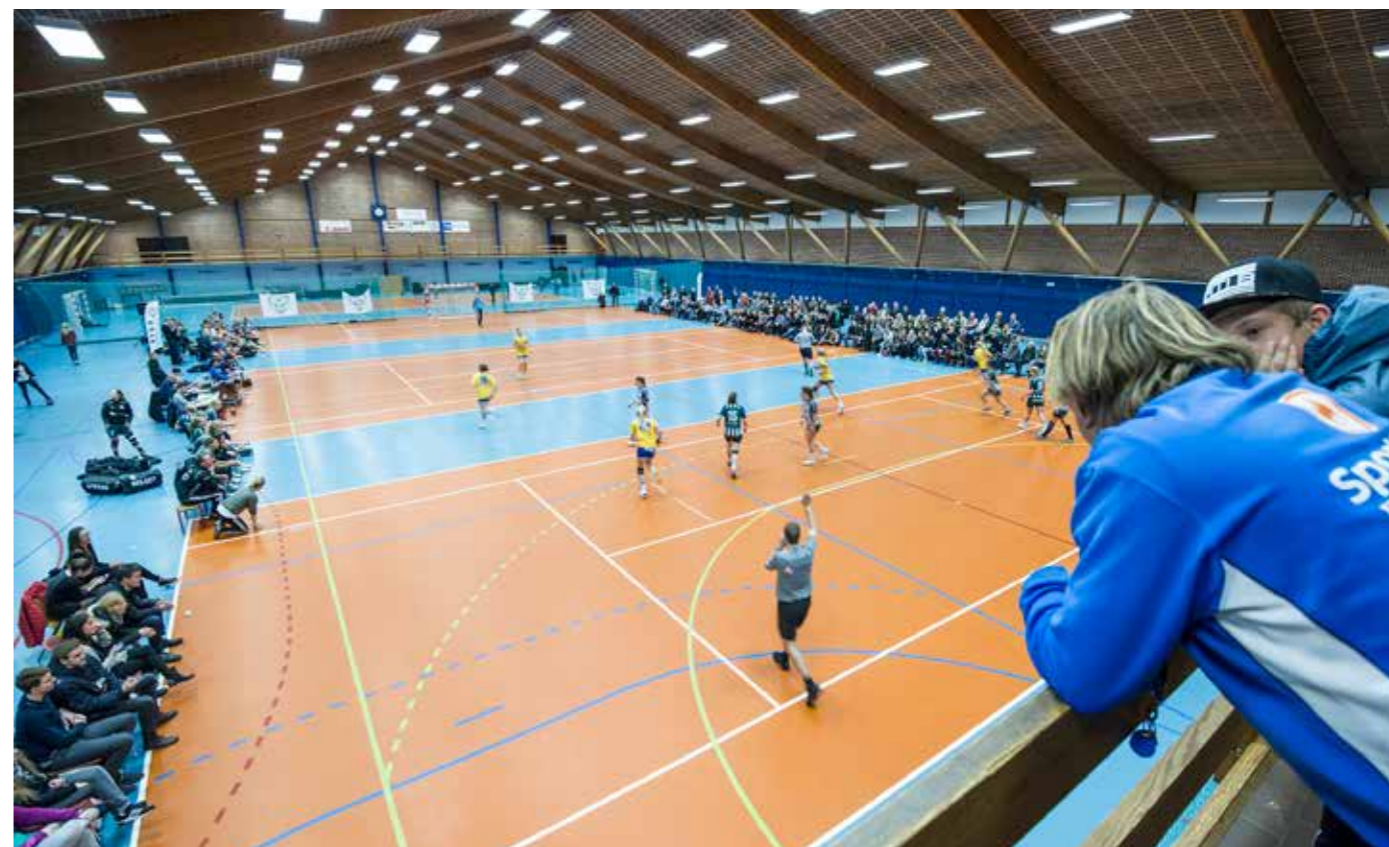
Hallen på ABs anlæg egner sig særdeles godt til håndbold. Til gengæld går det så ud over tennisspil- lerne, der ikke har mange muligheder for at dyrke deres sport indendørs i vintermånederne. FIG har hele tiden noget at kæmpe for sammen med klubberne.