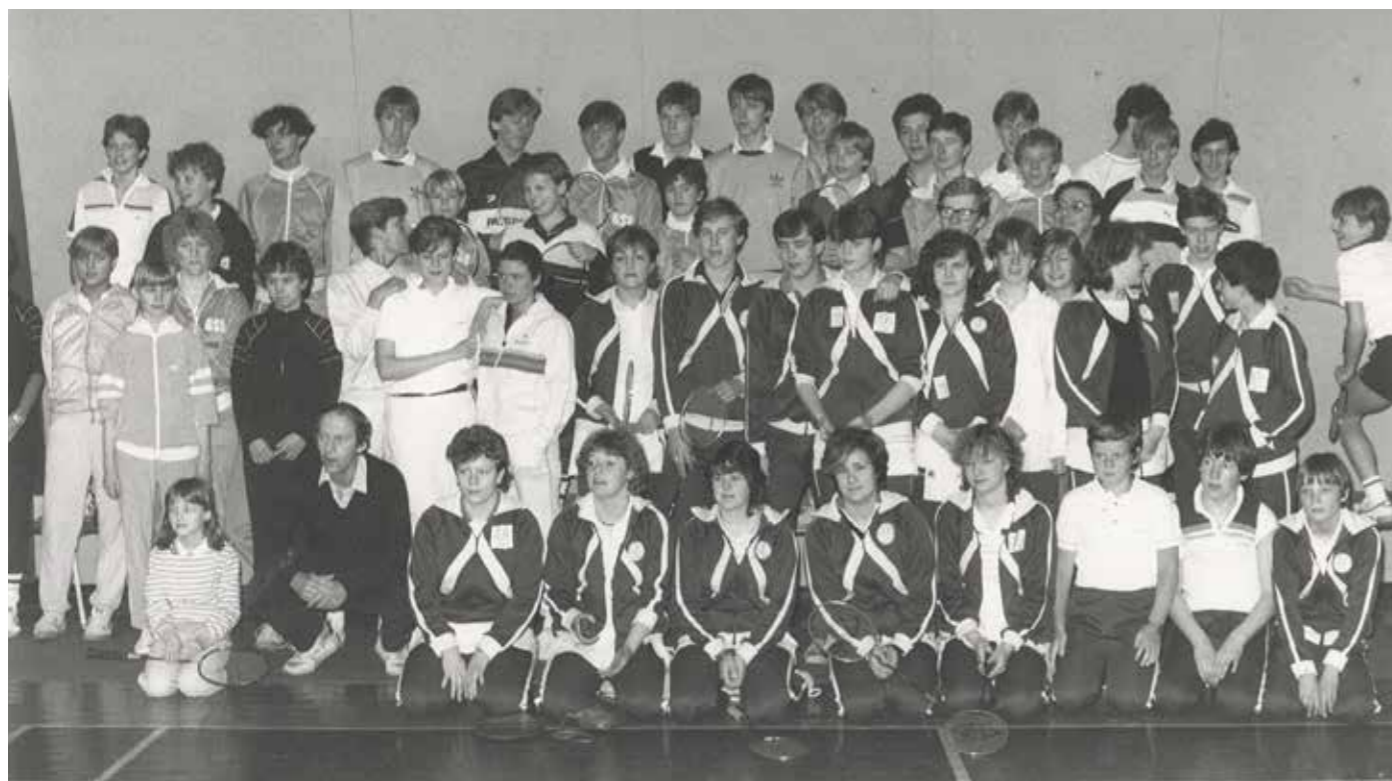
I 1983 indledte Gladsaxe-Søborg Badmintonklub et samarbejde med Carshalton Junior Badminton Club i venskabskommunen Sutton i England. På skift spillede ungdomsspillere mod hinanden. Det samarbejde varede i 30 år, før englænderne trak sig.

Skøjtehallen trængte virkelig til at få et ansigtsløft. Der var sat 4 millioner kroner af i første omgang, men hos FIG vurderede man, at det beløb nok burde være dobbelt så stort. Ved en ombygning kunne FIG måske rykke sit kontor fra sportshallen over i det gamle