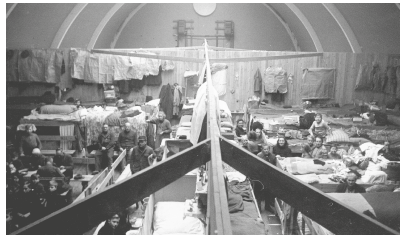
De tyske flygtninge var stuvet sammen i badmintonhallen, der var indrettet i sektioner. Området var spærret af med pigtråd.

Mens Bagsværd Idrætsforening var optaget, vendte tommelfingeren nedad da Gladsaxe