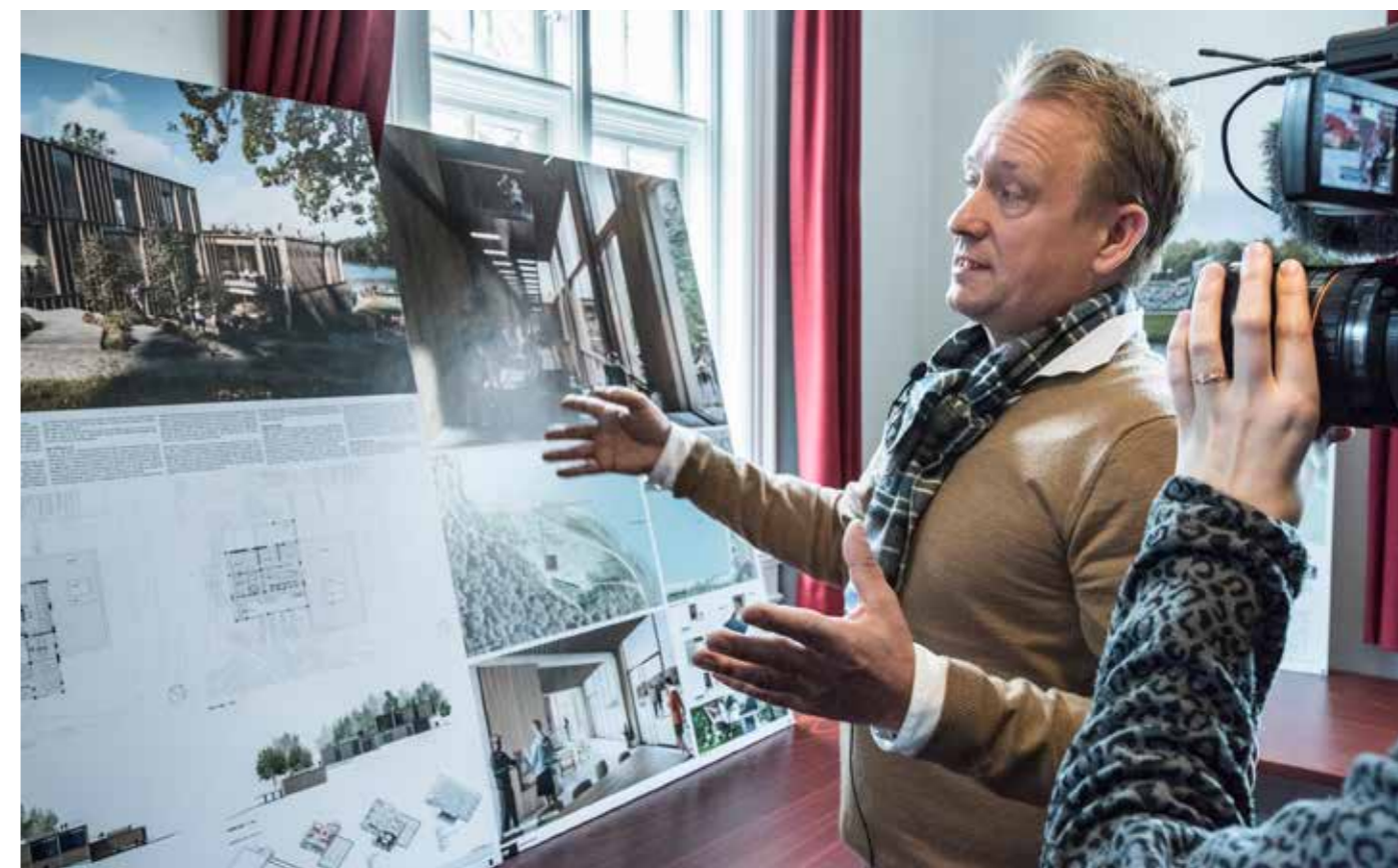
I 2017 forelå der et meget gennemarbejdet projekt for en opgradering af rostadion på Bagsværd Sø. Men det er ikke altid at sport og natur kan mødes, og projektet kunne ikke gennemføres.

FIG havde udviklet en handlingsplan, hvor faciliteter var hovedpunktet, men hvor man også talte om hvordan man udviklede talenter, der kunne ende i eliten.