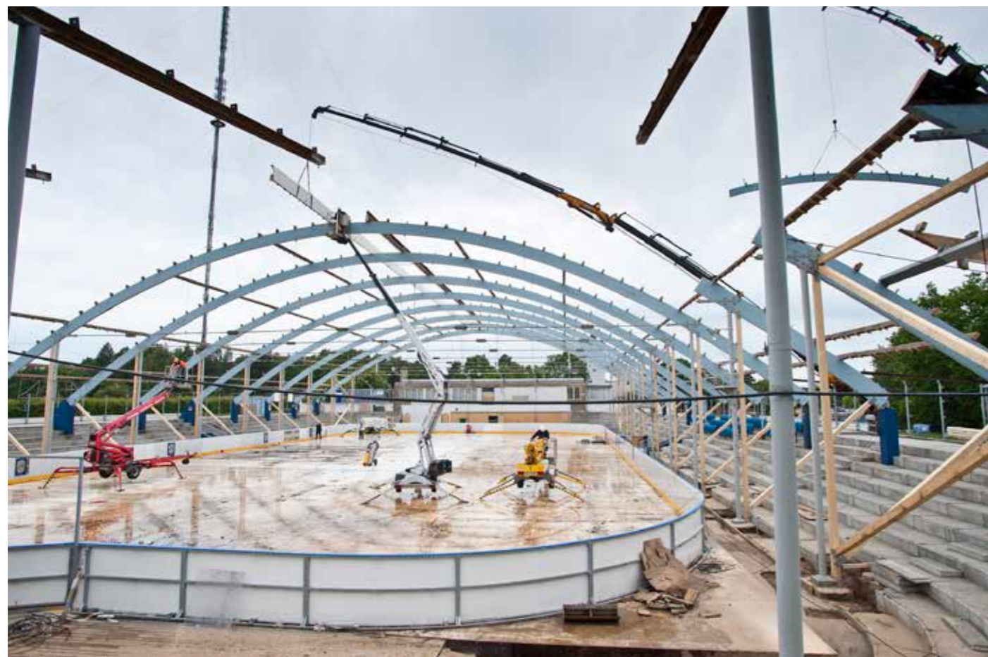
I årenes løb er der spenderet mange, mange millioner på at forbedre den gamle skøjtehal. Det blev forslået, at jævne den med jorden og begynde forfra med en ny hal, men klubberne frygtede, at de så aldrig ville komme i gang igen.

Skolereformen talte om, at eleverne hver dag skulle have mindst 45 minutters motion. Det skulle fremme indlæringen.