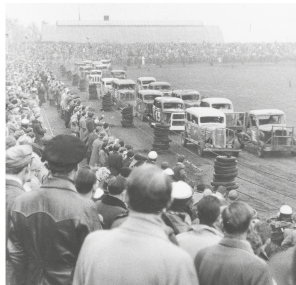
Stockcarløb eller skrammelbiløb samlede enorme tilskuermasser på Gladsaxe Stadion. Folk kom i bil, på motorcykel, cykel og på gåben. Det lignede en folkevandring fra linje 16 på Søborg Torv til Gladsaxe Stadion. Men op til ca. 20.000 tilskuere skabte problemer for sportsfolke- ne, der ofte mødte frem til ødelagte baner. FIG protesterede til politikerne og fik medhold.