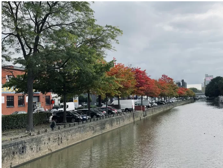
De kaaien tussen de Zwarte Hoekbrug en de Sint-Annabrug.

dan ga ik ervan uit dat we die even snel weer zullen wijzigen”, aldus Kiekens.