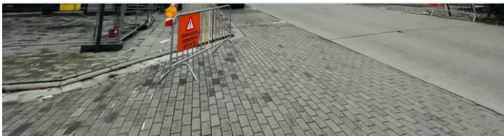
De kaaien tussen de Zwarte Hoekbrug en de Sint-Annabrug.

POPULAIR IN DE BUURT KIES UW GEMEENTE AALST