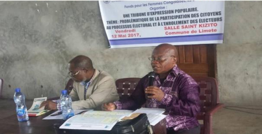
Fonds pour les Femmes Congolaises Organiser UNE TRIBUNE D'EXPRESSION POPULAIRE THEME: PROBLEMATIQUE DE LA PARTICIPATION DES CITOYENS AU PROCESSUS ELECTORAL ET A L'ENRICHISSEMENT DES CITOYENS Vendredi 12 Mai 2017, SALLE SAINT KIZITO Commune de Limete