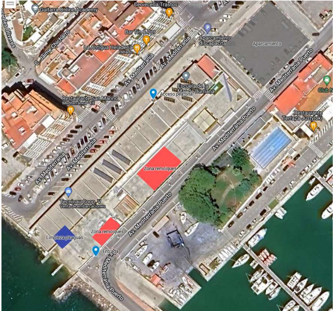
Plano de acceso a la Escola de la Mar