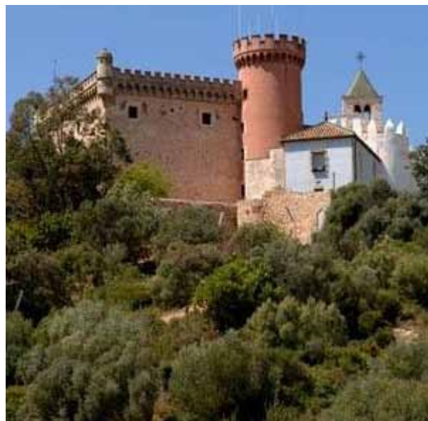
Castell De Castelldefels

La alegría de los grupos de empresa dejando presiones laborales por un rato, olvidadas.