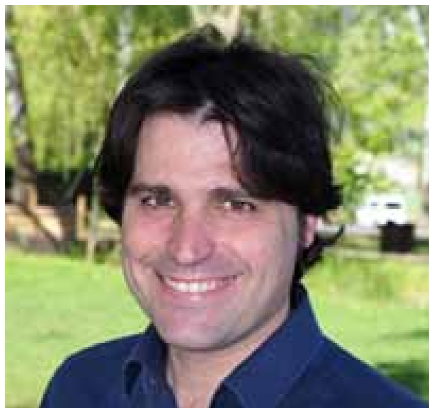
Director del Canal Olímpic de Catalunya

Pensem que el Canal Olímpic és un dels millors llocs per a la pràctica del piragüisme, en particular per al piragüisme de velocitat, i pensem que reunim les condicions òptimes per ser receptors de proves de primer nivell i que això permeti que el piragüisme creixi a Castelldefels i a Catalunya.