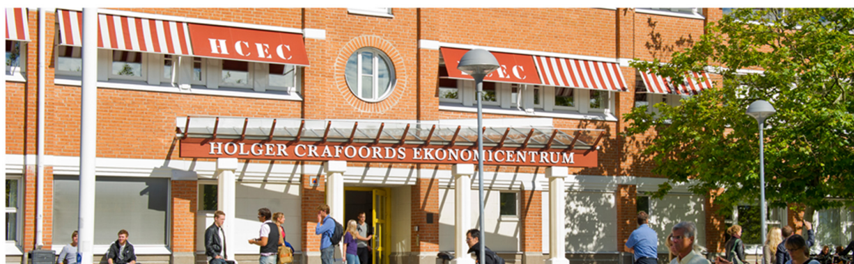
Kaj-Dac Tam Webb & design