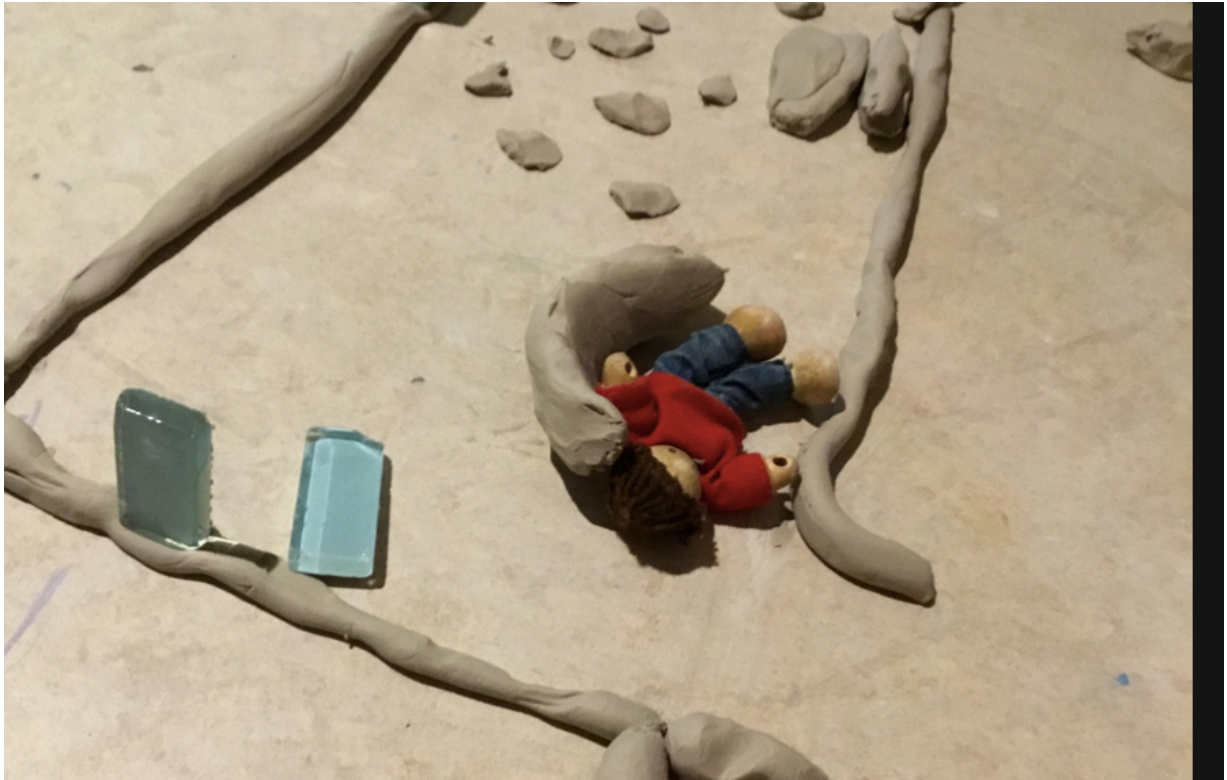
Undervisning i lera. Hur ser Sporren ut, här kan vi se att ett barn har gömt sig bakom en soffa.