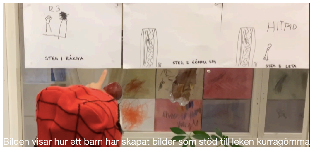
Bilden visar hur ett barn har skapat bilder som stöd till leken kurragömma

Vi pedagoger har utmanat barnen att skapa bilder som stöd till leken. Detta gör vi för att synliggöra lekens delar och möjliggöra inkludering för alla.