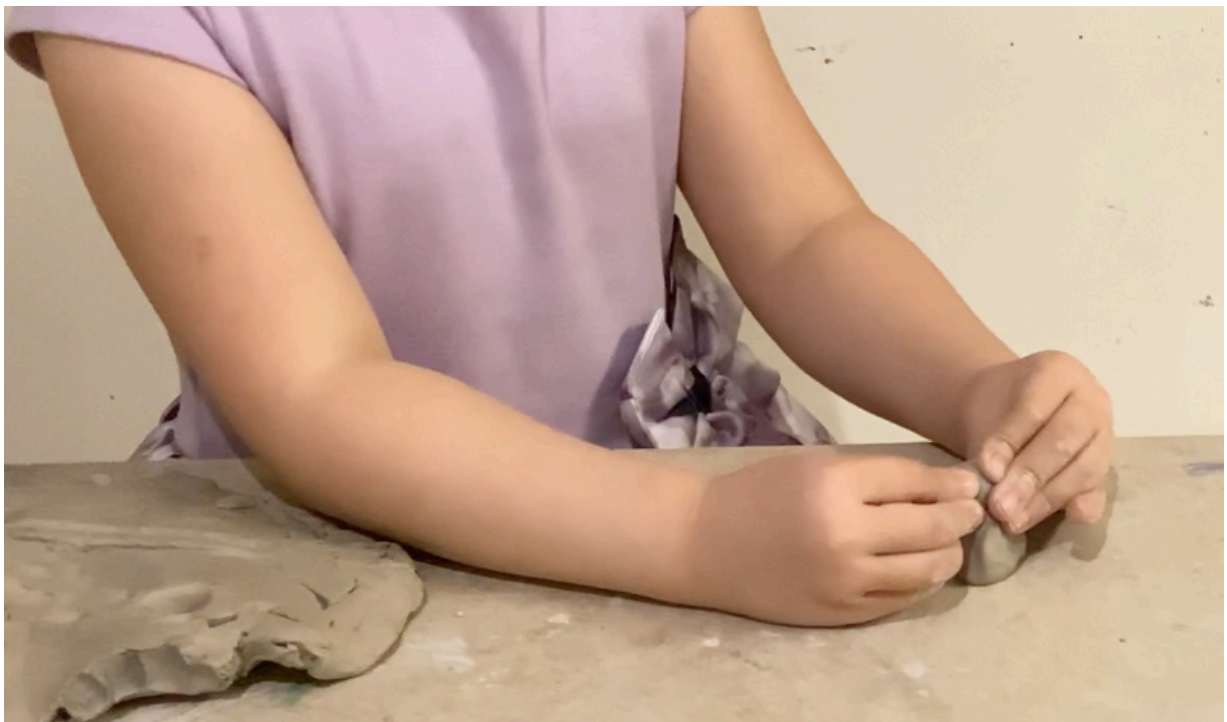
I den här undervisningen ville ett barn skapa tre små apor som skulle leka kurragömma. När de var klara lekte aporna kurragömma.