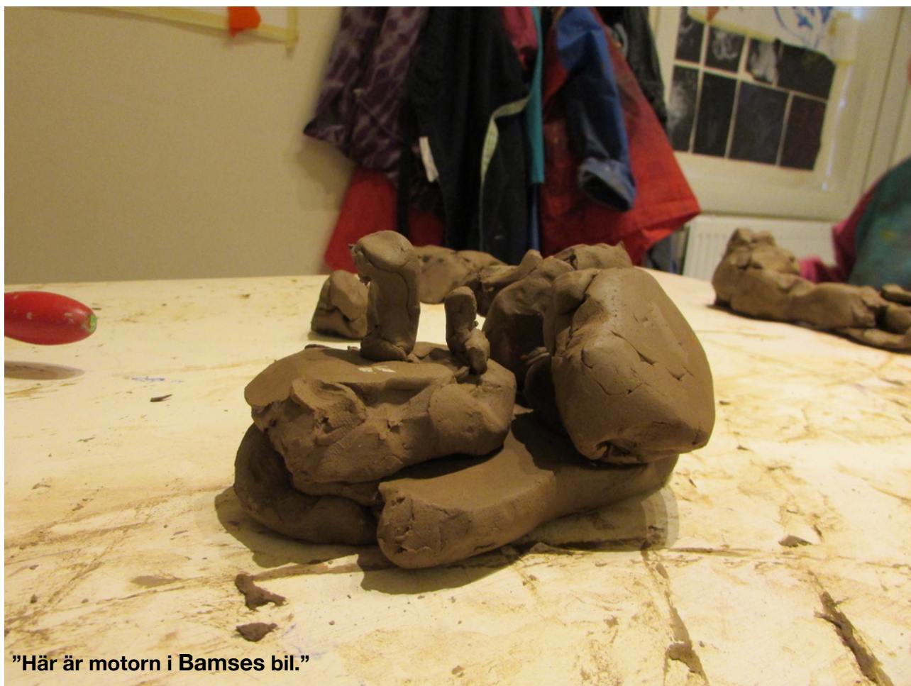
"Här är motorn i Bamses bil."

Vi såg att barnen behövde tid att utforska leran för att en del av dem inte har arbetat med materialet innan. Barnen behövde skapa en relation till leran för att sen kunna se varandra och samarbeta. Vid undervisningstillfällena och under andra tillfällen i utbildningen hittade barnen egna sätt att samarbeta.