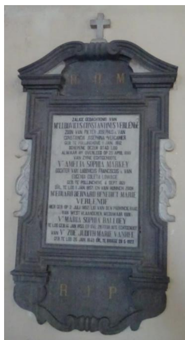
Obiits, terug te vinden in de St. Pieterskerk te Lo aangaande de familie Vanhee.