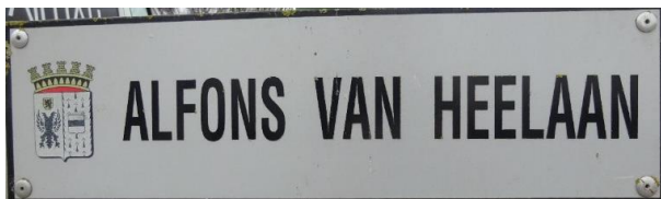
Alfons Van Hee Laan te Lo