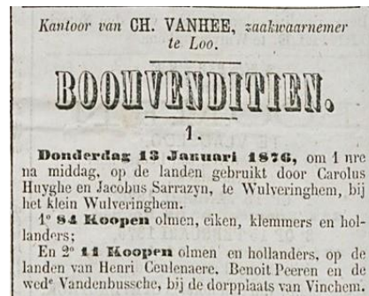
De Veurnaar / 22 maart 1876 / pag.2