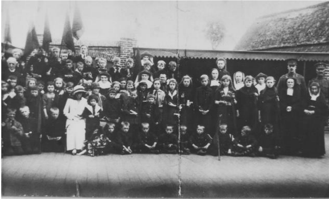
Foto genomen te Watou met de kinderen die klaar stonden om te vertrekken naar Zwitserland. In het wit Koningin Elisabeth met naast haar Miss Fyfe (dame met het hoedje)

Op 17 en 18 oktober 2015 had een herdenking plaats in het Kasteel van Vaulruz (Zwitserland) waar een ontmoeting voorzien was tussen familieleden van de Zwitserse opvanggezinnen en de familieleden van de Belgische vluchtelingen. Vaak zijn de vriendschapsbanden behouden over de generaties heen.